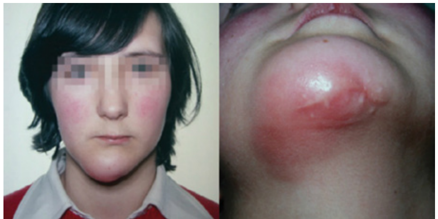
Slika 1. Pacijent sa periapikalnom lezijom u području donjih inciziva i kliničkom slikom submentalnog apscesa. Preuzeto iz (6)