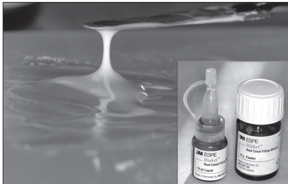
Slika 1. Diaket konzistencije vrhnja

Diaket ( ESPE, Njemačka) je poliketonski korijenski cement koji posjeduje dobra fizikalna svojstva. Nakon miješanja praška i tekućine postaje ljepljiv i dobro adherira na stijenku dentina (2). Na sobnoj temperaturi ostaje plastičan 6 minuta dok se u kanalu stvrdnjava brže (slika 1). Prije stvrdnjavanja otapa masti i organsko tkivo, zatim za vrijeme stvrdnjavanja lagano kontrahira što kompenzira apsorpcijom tragova vlage iz kanala (1).