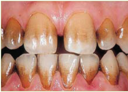
Slika 3. Diskoloracija zuba nastala uslijed korištenja CHX preparata (preuzeto iz 3)

vanjem klorheksidina i umanjivati njegovu djelotvornost.