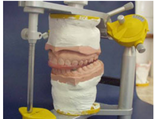
Slika 3: Lateralni registar u artikulatoru

Ako individualiziramo Bennettov kut, incidencija pozitivne pogreške na neradnoj strani se smanjuje na 2%, a na radnoj strani iznosi 7% (kod artikulatora sa srednjim vrijednostima ta pogreška iznosi 11% na neradnoj i 14% na radnoj strani).