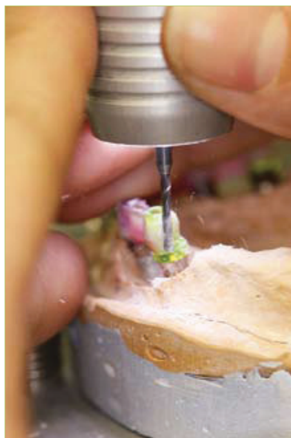
Slika 2. Freziranje voštanog profila za retencijsku prečku