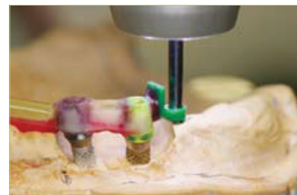
Slika 5. Ugradnja zglobne veze u paralelometru

lomičnih proteza te implantološka protetska terapija (slika 3).