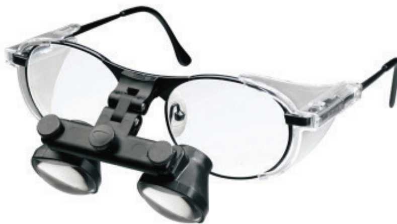
Slika 4. Naočale s povećalom