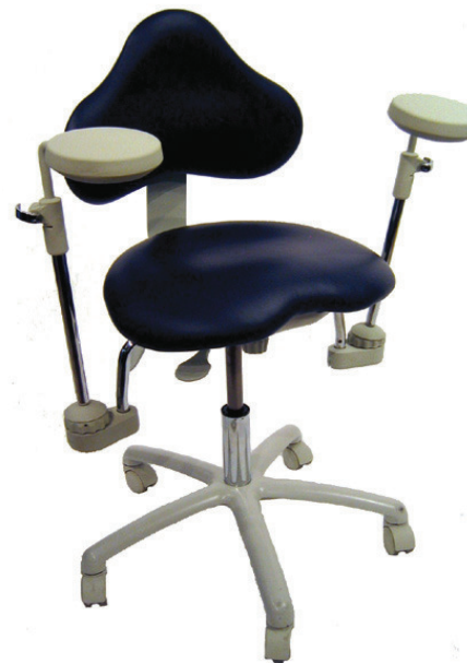
Slika 3. Moderni terapeutski stolac

Jutro je, vrijeme buđenja, a vi ne možete ustati iz kreveta zbog bolova u leđima ili vratu. Ovakav je scenarij svakodnevnica mnogih doktora dentalne medicine. Dok povremeni bolovi nisu razlog za uzbunu, bol i nelagoda koja se javlja redovito može dovesti do ozbiljnih i trajnih ozljeda, a uspješna karijera završiti invalidnošću.