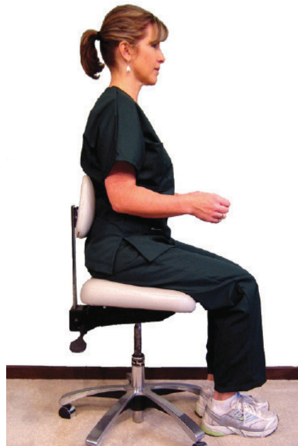
Slika 2. Pravilan sjedeći položaj s ravnim leđima