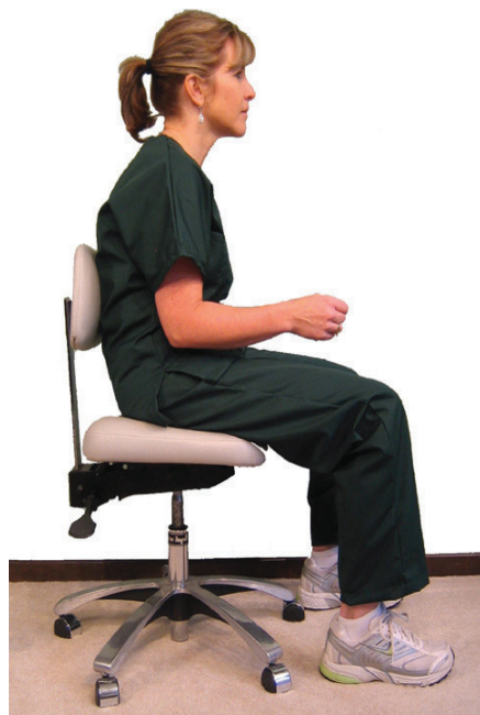
Slika 1. Nepravilan sjedeći položaj s pogrbljenim leđima

[2] Zavod za endodonciju i restaurativnu stomatologiju, Stomatološki fakultet Sveučilišta u Zagrebu