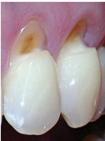
Slika 1. Abfrakcija