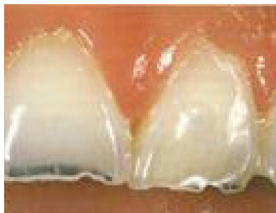
Slika 6. „Chipping“ - nepravilno nazubljeni incizalni bridovi