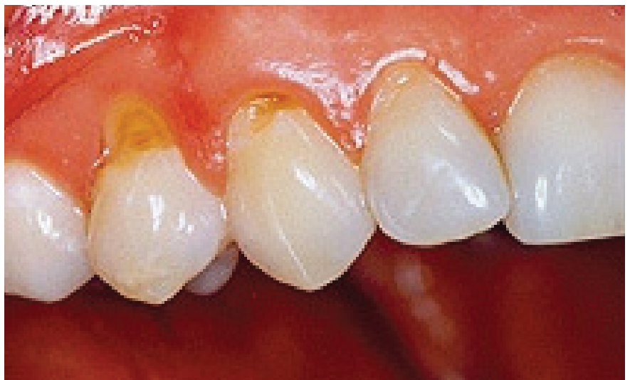
Slika 2. Abrazija