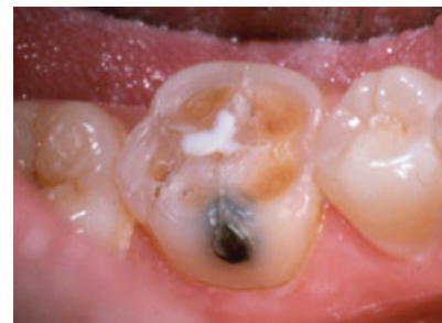
Slika 7. Erozijska lezija dovodi do ulegnuća kvržica kod stražnjih zuba - „Cupping“

nim uvjetima je prezasićena fosfatnim ionima, međutim zbog promijenjenog osmotskog stanja dolazi do razgradnje molekula hidroksilapatita i spajanja fosfatnih iona sa slobodnim ionima vodika, što pak uzrokuje otapanje površinskog dijela kristalne strukture hidroksilapatita i izravni prodor kiselina te ubrzan proces demineralizacije.