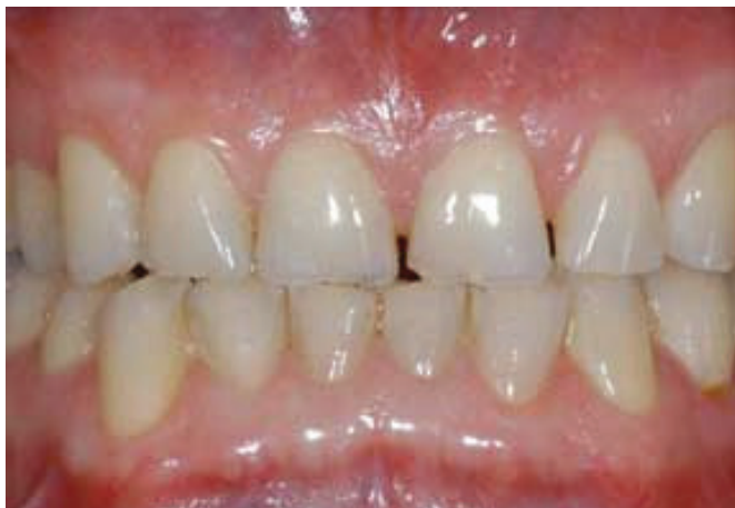
Slika 3. Atricija