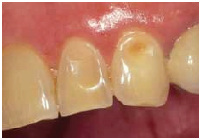
Slika 4. Eroziija

de radi specifičnu trokutastu uzuru između središnjih gornjih inciziva, drugi dijelovi Afrike u koničan oblik, dok u Americi neka indijanska plemena oštře zube kako bi nalikovali zubima zvijeri),