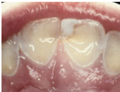
Slika 5. Erozijska lezija kod pacijentice koja boluje od bulimije