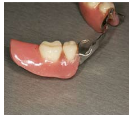
Slika 3. Nakon polimerizacije i poliranja