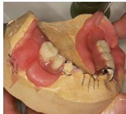
Slika 14. Uklanjanje viška akrilata

zubi najprije se uklanja puknuti zub. Pristup uklanjanju zuba mora uvijek biti napravljen s oralne strane, kako bi se zaštitile vestibularne strane proteze (ako je zub ispao navedeni postupak nije potreban). Važan korak je odabir novog zuba pri čemu treba paziti na oblik i nijanse boje, a potom se zub smješta na postojeće slobodno mjesto. Jako je važno smjestiti zub u pravilan položaj u odnosu na susjedne zube. Kada je zub pravilno postavljen učvrsti se za protezu s lingvalne strane ljepljivim voskom. Nakno toga provjerava se odnos s protezom u suprotnoj čeljusti. Vestibularni defekti također se popunjavaju voskom. Zamijeva se sadra i njome se prekriju sve vestibularne i okluzalne plohe zamjenskog i njemu susjednih zuba. Vosak se uklanja vrućom vodom, a na njegovo mjesto se stavlja autopolimerizirajući akrilat. U ovoj je fazi važna količina akrilata, jer premalo akrilata ostavlja praznine, a previše akrilata može smetati mekim tkivima ili poremetiti položaj zuba. Na-