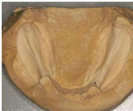
Slika 9. Radni model