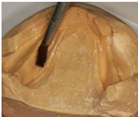
Slika 10. Premazivanje izolacijskim sredstvom