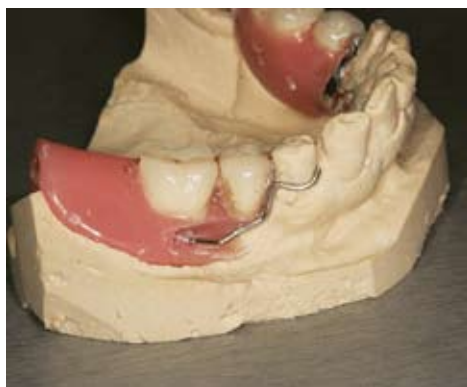
Slika 1. Modeliranje žičane kvačice

loma baze gornje proteze. U suprotnom potrebno je preko proteze u ustima uzeti otisak u alginatu. Ako prijelom baze ide čitavom dužinom proteze, onda je moguće da se pri uzimanju otiska dio pomakne. Zato se preporučuje da se prije uzimanja otiska u ustima učvrste dijelovi proteze autopolimerizirajućim