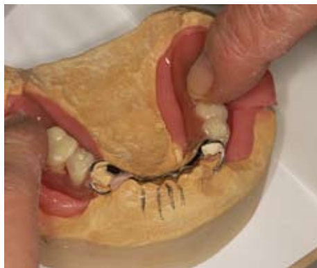
Slika 13. Postavljanje proteze na model i istiskivanje viška akrilata