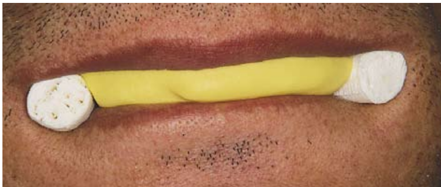
Slika 5. Uzimanje otiska u ustima pacijenta kitastim silikonom

akrilatom druge boje. Dijelovi slomljene proteze učvrste se u ustima pacijenta u točnom položaju. Otisak je dobar ako se dijelovi ne pomaknu i ako su međusobno spojeni bez međuprostora. U laboratoriju se izlije radni model i nakon vezanja gipsa, vadi se žlica s otisnim materijalom(2). Bilo je pokušaja reparature uz upotrebu metalnog «pojačivača» u obliku žice ili metalne mrežice sa ciljem jačanja čvrstoće proteze i samim tim produljenja trajnosti proteze. No, istraživanja su pokazala da upotreba takvih metalnih pojačivača zapravo više oslabljuje nego ojačava repariranu protezu. Različiti moduli elastičnosti metala i akrilata dovode do stvaranja mikropukotina te širenja i rasta takvih pukotina pri uporabi proteze (3). Kao nova metoda izbora nameće se uporaba impregni-ranih staklenih vlakana u matriksu od hladno polimerizirajućeg akrilata, koja su pokazala veću čvrstoću reparirane proteze u odnosu na istovjetnu nerepariranu.