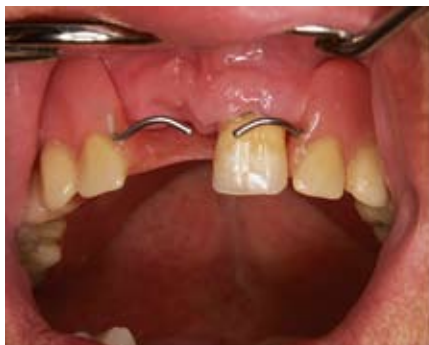
Slika 4. Zub je izvađen i potrebno ga je nadomjestiti proteznim zubom

akrilatom druge boje. Dijelovi slomljene proteze učvrste se u ustima pacijenta u točnom položaju. Otisak je dobar ako se dijelovi ne pomaknu i ako su međusobno spojeni bez međuprostora. U laboratoriju se izlije radni model i nakon vezanja gipsa, vadi se žlica s otisnim materijalom(2). Bilo je pokušaja reparature uz upotrebu metalnog «pojačivača» u obliku žice ili metalne mrežice sa ciljem jačanja čvrstoće proteze i samim tim produljenja trajnosti proteze. No, istraživanja su pokazala da upotreba takvih metalnih pojačivača zapravo više oslabljuje nego ojačava repariranu protezu. Različiti moduli elastičnosti metala i akrilata dovode do stvaranja mikropukotina te širenja i rasta takvih pukotina pri uporabi proteze (3). Kao nova metoda izbora nameće se uporaba impregni-ranih staklenih vlakana u matriksu od hladno polimerizirajućeg akrilata, koja su pokazala veću čvrstoću reparirane proteze u odnosu na istovjetnu nerepariranu.