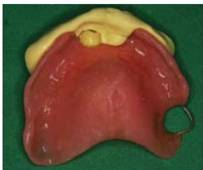
Slika 6. Otisak nakon vađenja

Kod reparature kvačice važno je utvrditi i otkloniti razlog oštećenja kvačice. Uzima se otisak preko proteze u ustima (2). Prilikom vađenja otiska potreban je povećani oprez kako ne bi došlo do pomaka proteze u otisku. Prije izlivanja modela potkopane površine proteze potrebno je prekriti voskom, kako bi nakon stvrdnjavanja sadre mogli izvaditi protezu bez straha da dio sadre pukne ili se odlomi. Sljedeći korak je analiza modela. Model je potrebno staviti u paralelometar kako bi utvrdili najpovoljniji smjer uvođenja proteze, ekvator zuba na kojem smiještamo kvačicu i potkopane predjele. Na zubu se ucrtta smještaj buduće kvačice, a potom se oblikuje kvačica od žice. (Slika 1.) Nakon oblikovanja kvačica se postavlja na zub na radnom modelu u željeni položaj, a kako bi ostala u točnom položaju za vrijeme dodavanja akrilata, zalijepi se ljepljivim voskom. Zatim se dodaje akrilat, koji se polimerizira, obrađuje i polira (4). (Slika 2. i 3.)