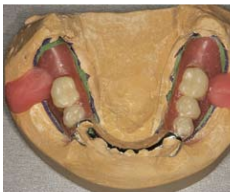
Slika 11a i b. Oblikovanje ključa od akrilata za provjeru točnosti prilijeganja proteze na model.

Reparatura zuba u protezi smatra se najlakšom od svih reparaturnih postupaka. U slučaju puknuća zuba ili