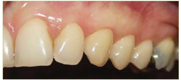
Slika 10. Rezultati nakon 2 godine

i trauma uzrokovanih nepravilnim četkanjem, dok su klase III i IV najčešće posljedica parodontitisa i parodontne terapije.