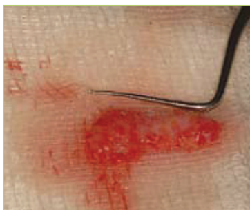
Slika 6. Vezivni transplantat

sija, iako postoje rijetke indikacije kada ga možemo primijeniti i u svrhu prekrivanja recesija, kao estetsku indikaciju. Prednost slobodnog gingivalnog transplantata u odnosu na subepitelni vezivni režanj, koji se najčešće koristi kao tehnika prekrivanja recesije, je u tome što SGT osigurava bolje povećanje apikokoronarne debljine pričvrstne gingive. Danas se u mukogingivalnoj kirurgiji koriste 2 tehnike presađivanja slobodnog gingivalnog transplantata; prema Milleru i Bernimoulinu - izravna i neizravna tehnika.