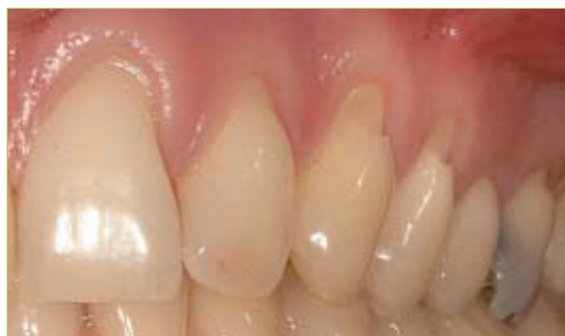
Slika 5. Klinasti defekti i multiple recesije - inicijalna situacija