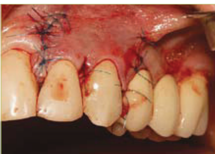
Slika 3. Koronarno pomaknut režanj šavovima je pričvršćen u razini caklinsko-cementnog spojišta

Peteljasti režanj je skup nekoliko sličnih tehnika koje se međusobno razlikuju prema smjeru pomaka režnja, vrsti rezova i šavova, a princip im je postavljanje mekog tkiva oko područja recesije preko samog defekta, tako da jedan dio režnja uvijek ostaje vezan za okolno tkivo. Postoje lateralni, koronalni i polumjesečasti pomaknuti režanj. Nakon početnog prekrivanja recesije, javljaju se komplikacije, pa tako kod lateralnog nastaje recesija na susjednom zubu s kojeg je pomaknuta