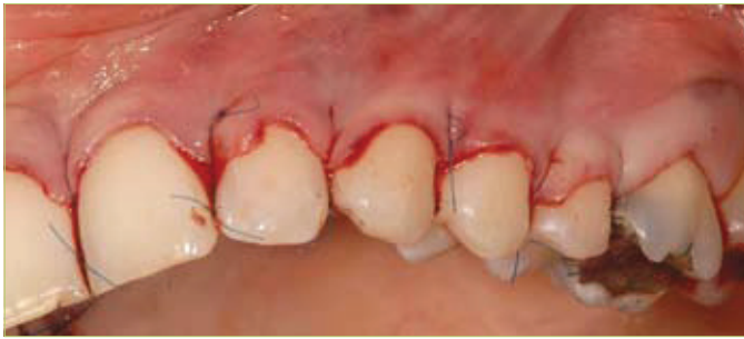
Slika 9. Šavovi učvršćuju koronarno pomaknuti režanj oko zuba i na interdentalna ležišta vezivnog tkiva