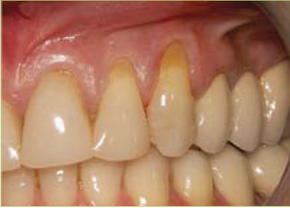
Slika 1. Recesije na zubima 22 i 23 - inicijalna situacija

čvrstne gingive, produbljenje vestibuluma i prekrivanje recesija. Mukogingivalna kirurška terapija trebala bi rezultirati povećanjem apikokoronarne i bukolingvalne dimenzije gingivnog tkiva i uspostavom odgovarajuće vestibularne dubine, gdje je to potrebno. Novoformirana pričvrtna gingiva treba imati dovoljan volumen i integritet kako bi se sanirala postojeća recesija, a to znači prekrivanje ogoljelog korijena do razine caklinsko-cementnog spojišta, s posljedičnim nastankom plitkog sulkusa. Prekrivanje recesije danas je jedan od najčešćih zahvata, prvenstveno zbog estetskih indikacija.