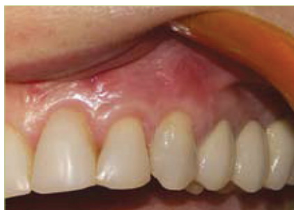
Slika 4. Prikaz rezultata nakon 1 godine