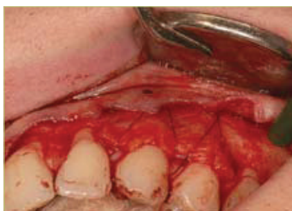
Slika 8. Transplantat postavljen na mjesto ležišta (tehnika po Zucchelliju)

grešaka nastalih prilikom direktne tehnike, iako je njena uporaba dosta rijetka.