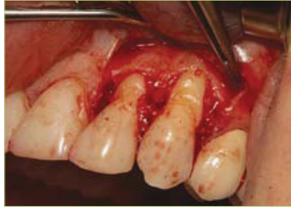
Slika 2. Prikaz odignutog režnja

marginalna gingiva zajedno s režnjem. Kod koronalno pomaknutog režnja nastaje recidiv ili nekroza, ako je režanj pretanak, a kod polumjesečastog može doći do ekspaniranja dehiscijencije korijena. Danas se koriste modificirane tehnike, kojima se komplikacije nastoje svesti na minimum (slike 1, 2, 3, 4) (2, 3).