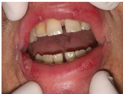
Slika 1. Alergijski kontaktni stomatitis – labijalni edem

poznat budući da je udio minerala u propolisu jako nizak. Također se pokazalo da pozitivno djeluje u terapiji dentinske preosjetljivosti (22).