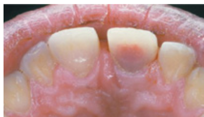
Slika 1. Ružičasto prosvijetljenje krune zuba

Nekirurška terapija sastoji se u trepanaciji zuba, uklanjanju preostalog vitalnoga pulpnoga tkiva i novonastaloga granulacijskog tkiva (2).