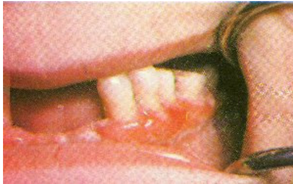
Slika 5: Gubitak zuba uzrokovan destruktijom alveolarne kosti