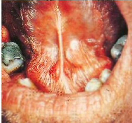
Slika 1: Xerostomia