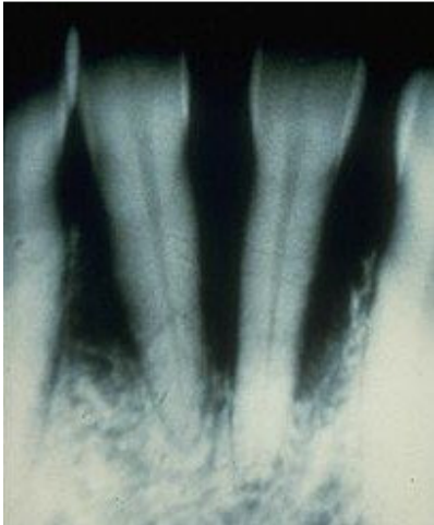
Slika 4: Izrazita destruktija alveolarne kosti donjih sjekutića uslijed parodontitisa

sklonost upali i ranjivost sluznice, kao i povećana učestalost Lichen ruber-a. Kod dijabetičke mikroangiopatije slabija je opskrba krvlju te nastaju pulpitisi i atrofija papila jezika (očituje se kao lingua glabra). Odlaganje PAS pozitivnih infiltrata u površinskom sloju epitela, u međustaničnom prostoru epitela te u krvnim žilama uzrok je otvrdnjavanju navedenih struktura što uvelike otežava mogućnost cijeljenja, povećava ranjivost tkiva, smanjuje otpornost na infekcije (posebno gingive). Nepravilnosti u metaboličkim biokemijskim reakcijama također uzrokuju neke od lokalnih poremećaja poput slabog cijeljenja rana (uključujući i cijeljenje periapikalnih procesa nakon endodontskih instrumentiranja) te povećane sklonosti infekcijama.