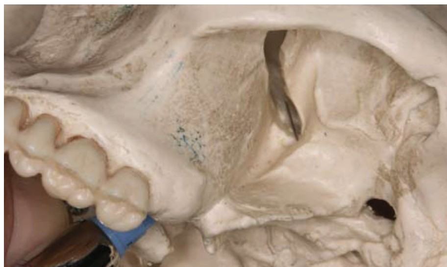
Slika 7. Prikaz palatinalnog pristupa za maksilarni blok na modelu.

strane gornjeg drugog molara. Posušimo ga sterilnom gazom te na njega nanesimo topikalni anestetik. Pacijent djelomično otvori usta i primaknemo donju čeljust na onu stranu na koju dajemo anestetik. Obraz odmaknemo kažiprstom i nategnemo meko tkivo. Vrh igle položimo na ubodno mjesto i iglom polako prodiremo prema unutra, gore i natrag. Ne smijemo osjetiti nikakav otpor. Dubina penetracije mora iznositi otprilike 30 mm i odgovara anatomskom položaju pterigopalatinalne udubine (Slika 5). Prvo aspiriramo, ako je aspiracija negativna, na tom mjestu deponiramo 1.8 ml anestetika kroz jednu minutu. Tijekom deponiranja aspiriramo nekoliko puta. Nakon što smo izvadili iglu, pričekamo 3-5 min na početak tretmana (5).