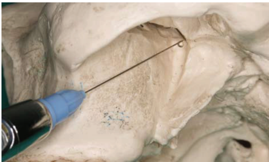
Slika 5. Prikaz tubarnog pristupa za maksilarni blok na modelu.