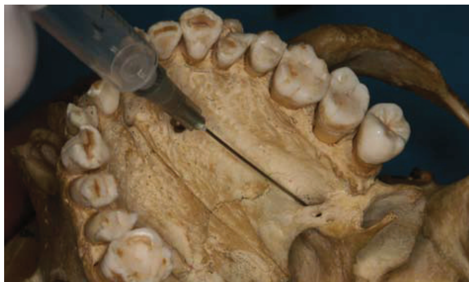
Slika 6. Ciljno mjesto za tehniku maksilarnog bloka (palatinalni pristup).