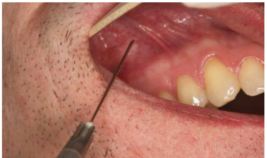
Slika 2. Klinički prikaz MSA tehnike.