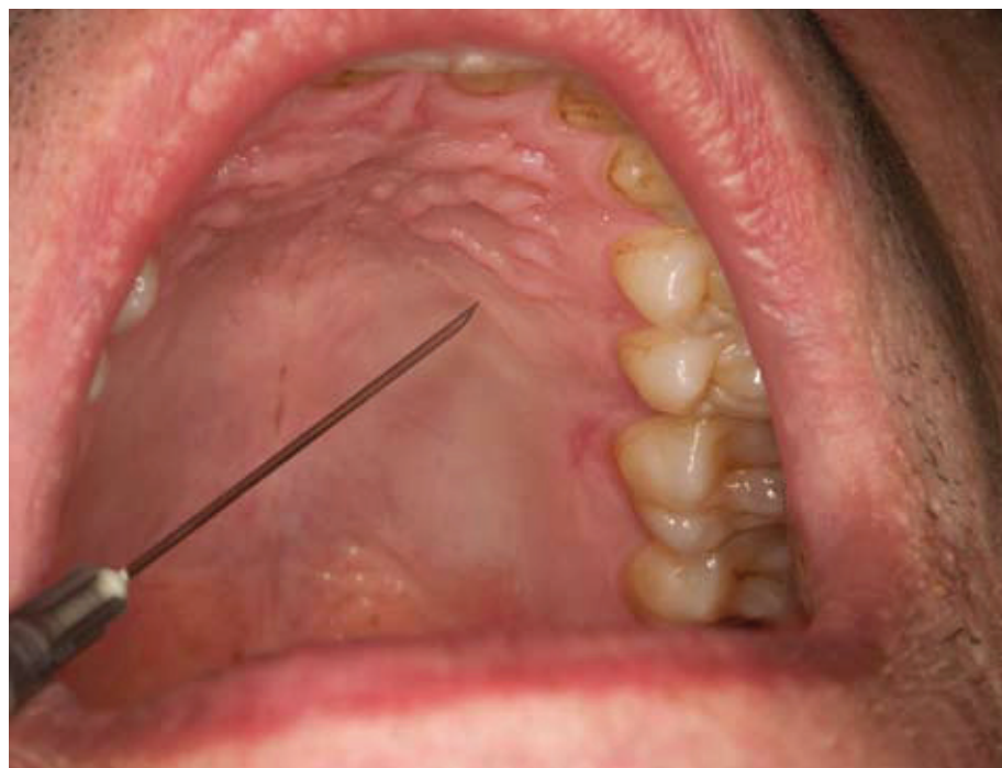
Slika 4. Klinički prikaz AMSA tehnike.