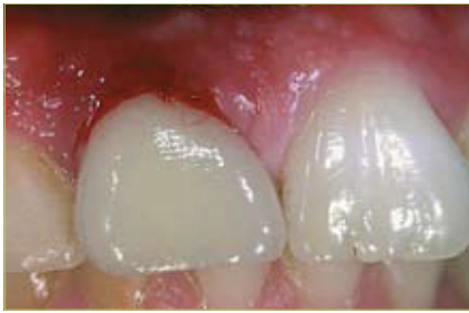
Slika 1. Periimplantatni mukozitis u području zuba 11. Karakteriziran je krvarenjem pri sondiranju, odsutnost gnojenja.