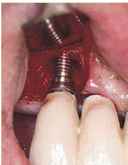
Slika 3. Klinički prikaz kirurški izloženog implantata zahvaćenog periimplantitisom. Vidljiv je cirkumferentni gubitak kosti. (preuzeto iz 4)

Postoji i tzv. retrogradni periimplantitis. To je lezija oko najapikalnijeg područja oseointegriranog implantata koja se javlja u prvim mjesecima nakon implantacije. Uzrokuje ga zaostalo granulatozno tkivo porijeklom od izvađenog