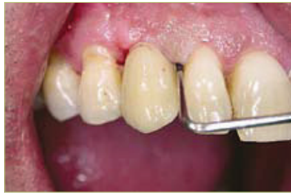
Slika 2. Periimplantitis u području zuba 13. Prisutno je krvarenje pri sondiranju, dubina sondiranja >3mm.

endodontski tretiranog zuba ili nastaje zbog endodontske patologije susjednih zuba (7).