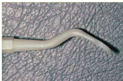
Slika 5. Plastična kireta za mehaničko čišćenje implantata, koja neće oštetiti njegovu površinu. (preuzeto iz 4)

ranjem površine implantata gumicama i pustom za poliranje.