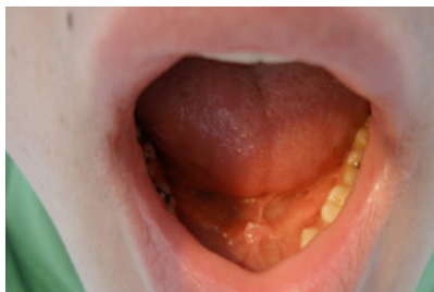
Slika 8. HPV-sublingvalni kondilom.