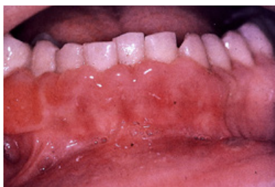
Slika 1. Gingivostomatitis herpeticus.

Gonoreja je najčešća bakterijska spolno prenosiva bolest u svijetu. Uzrokovana je bakterijom Neisseria gonorrhoeae , a klinički je obilježena pojavom žutozelenog purulentnog iscjetka. Najčešći put prijenosa je spolni kontakt: vaginalnim putem, oralno ili analno; inkubacija je kratka i iznosi 2-4