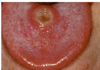
Slika 5. Sifilis-primarni stadij; ulcus durum na jeziku.