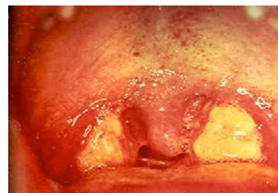
Slika 6. EBV-sindrom glandularne groznice.