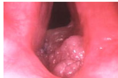
Slika 9. HPV-laringealna papilomatoza.