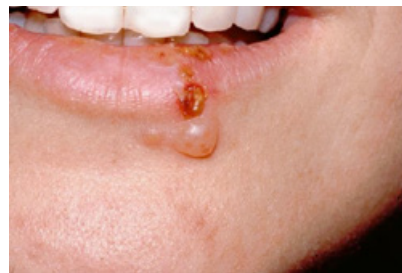
Slike 2, 3. Herpes simplex infekcija.