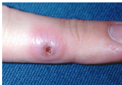
Slika 4. Herpetična lezija (zanoktica)-infekcija HSV na prstu.

EBV je bitan i kao uzročnik leukoplakije sluznice jezika, tzv. „Oral hairy leukoplakia“ (OHL) koja se pojavljuje u imunokompromitiranih pacijenata. Prvi put je opisana 1980-tih godina i učestali je nalaz u bolesnika s AIDS-om te se smatra znakom njegove progresije. U 5% HIV-pozitivnih osoba može biti prvi znak infekcije. Kliničku sliku karakteriziraju hiperplastične i verukozne adherentne naslage tipično smještene na lateralnim stranama jezika. Bijele su ili svijetlo