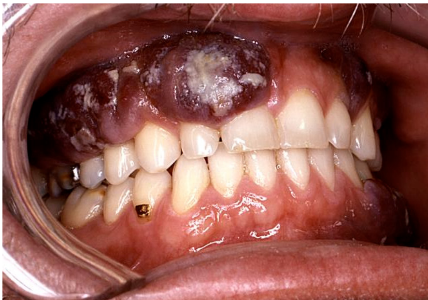
Slika 11. HIV-Kaposi sarkom.