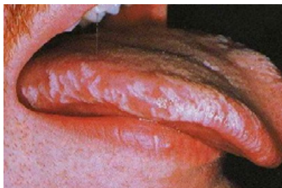
Slika 7. EBV-vlasasta leukoplakija.

Spolno prenosive infekcije su jedan od vodećih uzroka akutnih bolesti, kroničnog oštećenja zdravlja i smrtnosti, s mogućim teškim tjelesnim i psihološkim posljedicama. Oskudni simptomi ili njihov izostanak olakšavaju širenje infekcije u populaciji (28).