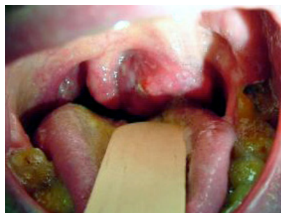
Slika 10. HPV-om uzrokovani karcinom grla.

* Slike 1-11 Ljubaznošću dr. sc. Marije Buljan