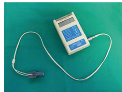
Slika 3. Puls oksimetar – senzor u obliku štipaljke se postavlja na prst, a na displeju se prikazuje zasićenost arterijske krvi kisikom i puls