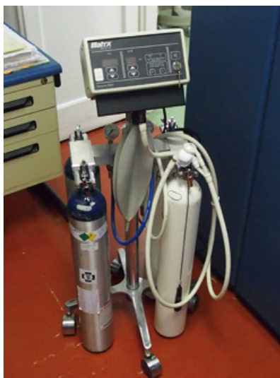
Slika 2. Aparat za sedaciju dušikovim oksidulom