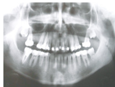
Slika 7. Radiološki nalaz nakon 8 mjeseci. Vidljivo cijeljenje PDL-a i razvoj korijena transplantiranog zuba.

U slučaju oštećenja Hertwigove ovojnice transplantata biti će limitiran ili inhibiran daljnji rast i razvoj korijena, ovisno o veličini traume (1, 6). Vrijeme manipulacije zubom donatorom treba biti što kraće te kirurg treba izbjegavati kontakt s korijenom zuba. Potom se zub smjesti u novu alveolu (Slika 5) koja mora biti 1-2 mm šira i dublja od zuba donora radi očuvanja parodontnog ligamenta (9). Time se postiže i optimalni kontakt zuba s koštanim zidom radi bolje opskrbe krvlju. Ako je potrebno dodatno oblikovanje alveole, transplantat se može pohraniti u originalnu alveolu dok se prilagodba ne završi (4, 10). Zub treba biti u infraokluziji kako bi mu se omogućilo izrastanje paralelno s razvojem korijena tokom sljedećih mjeseci (7). Ako je potrebno, radi boljeg pozicioniranja u zubnom luku, zub se može i rotirati (6, 12). Šavovima se transplantat stabilizira (Slika 6) te se dodatno fiksira splintom.