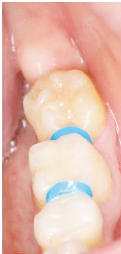
Slika 8. Klinički nalaz nakon 8 mjeseci.

se i mogućnost uspješne revaskularizacije pulpe te povećava šansa za nekrozu (6). Također vrijeme koje zub donor provede izvan alveole za vrijeme transplantacije negativno djeluje na ponovnu uspostavu mikrocirkulacije.