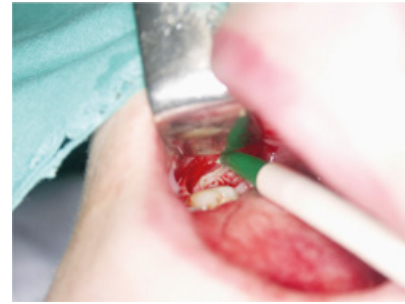
Slika 4. Ekstrakcija zametka 48.