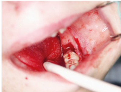
Slika 3. Prazna alveola nakon ekstrakcije zuba 37.