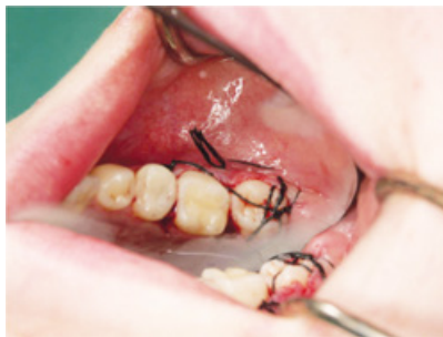
Slika 6. Transplantirani zub fiksiran šavovima.