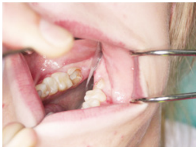
Slika 2. Zub 37 za ekstrakciju.