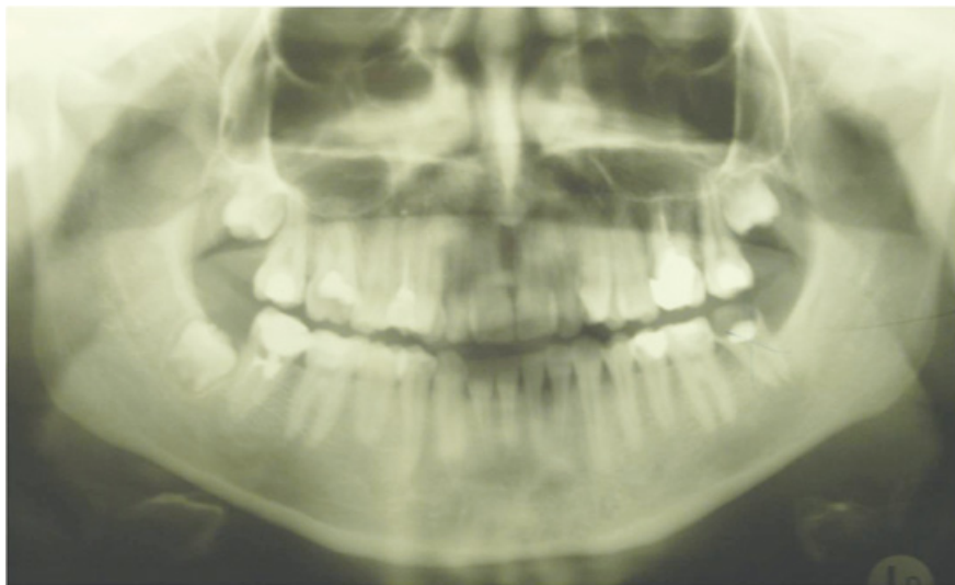
Slika 1. Na ortopantomogramu je vidljiv zub 37 destruiran karijesom. Zub donora 48 je u početnom stadiju razvoja korijena.

[2] Zavod za oralnu kirurgiju, Stomatološki fakultet Sveučilišta u Zagrebu