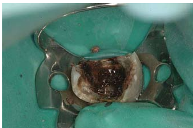
Slika 1a. Loše opturiran korijenski kanal,

Revizija endodontskog punjenja je postupak kojim se uklanja materijal za punjenje iz korijenskog kanala i nastoje se ukloniti mikroorganizmi u kanalnom prostoru. Ponovnim punjenjem, nakon obrade stijenki i dezinfekcije prostora, nastojimo osigurati trodimenzionalno brtvljenje endodontskog prostora. Danas se za punjenje najčešće rabi kombinacija gutaperke i punila, iako se u novije vrijeme za punjenje korijenskog kanala rabe i materijali temeljeni na Rezilonu i kompozitnoj smoli te silikonska punila sa ili bez djelića gutaperke. Dokazano je da je Rezilon topljiv u istim sredstvima kao i gutaperka štapić. Gutaperka je topljiva u različitim otapalima kao što su kloroform, eukalptusovo ulje, halotan i sl. Kloroform je najučinkovitije sredstvo za otapanje gutaperke, ali se zbog dokazanog mutagenog djelovanja i sumnje na moguću kancerogenost danas više ne rabi. Treba napomenuti da neka istraživanja pokazuju da je količina i zaostatnog kloroforma nakon revizije višestruko ispod opasne razine te da je vrijeme kontakta