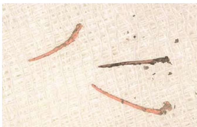
Slika 1b. Uklonjene gutaperke iz korijenskog kanala