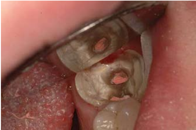
Slika 1c. Nakon revizije vidljiva dobra opturacija endodontskog prostora