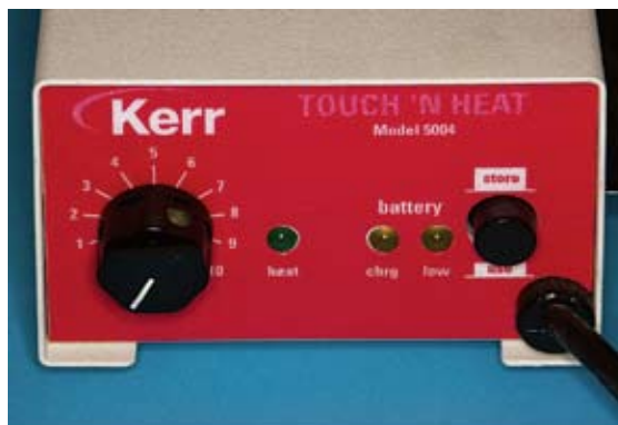
Slika 5. Touch'n Heat uređaj

U zavijenim i jako uskim korijenskim kanalima je to teško postići i bolje je u takvim slučajevima za apeksnu trećinu uporabiti ručne instrumente.