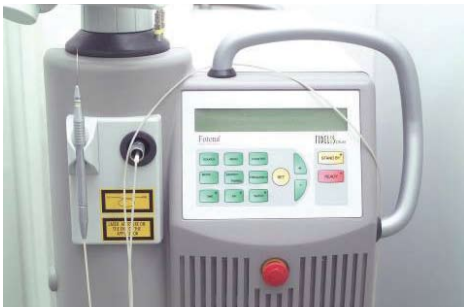
Slika 6. Nd:YAG laser