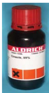
Slika 3. Otopina eukaliptusovog ulja koja se rabi za reviziju