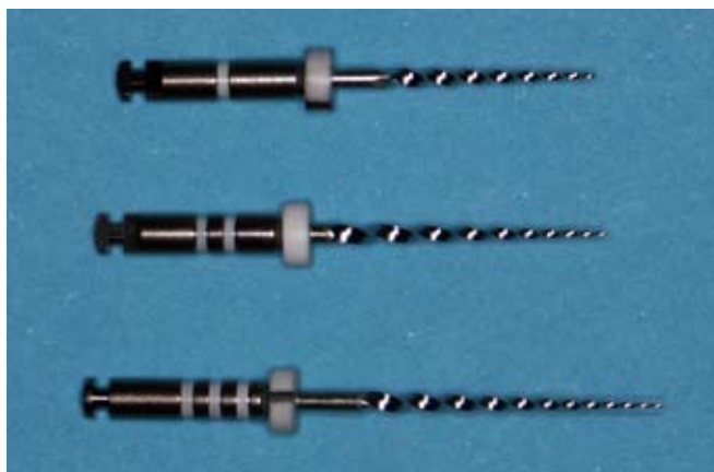
Slika 4. ProTaper instrumenti za reviziju