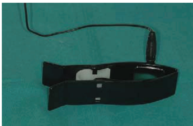
Slika 1. Elektroda iontodenta

Amato S. (6.) objašnjava antibakterijski učinak iontoforeze promjenom lokalne pH vrijednosti. Prema autorovu mišljenju, natrijev klorid disocira na ione klorida (Cl) i ione natrija (Na+) koji nastoje putovati do suprotno nabijenih elektroda, gdje reagiraju s vodom. Kloridni ioni u reakciji s molekulom vode stvaraju klorovodičnu kiselinu (HCl), a natrijevi ioni stvaraju natrijev hidroksid (NaOH). Djelovanjem električne energije, disocijacijom novo stvorenih spojeva nastaju: od HCl ioni vodika (H+) i ioni klorida (Cl - ) ioni, a od NaOH nastaju ioni natrija (Na+) i hidroksilni (OH - ) ioni. Tako stvoreni ioni nastoje putovati do elektroda odgovarajućeg potencijala te na mjestima gdje se koncentriraju u većoj količini uzrokuju lokalne promjene vrijednosti pH (npr. unutar kanala i dentinskih tubulusa). Oko anode vrijednost može biti pH 1, a oko katode vrijednost pH 11. Lužnatost ili kiselost koje nastaju destruktivne su za većinu bakterija, a budući da je pozitivna katoda smještena na ruci pacijenta, a negativna anoda u ustima ili na zubu, to se negativni OH ioni udaljuju od anode i pokušavaju putovati