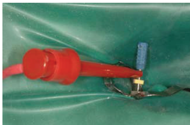
Slika 2. Iontodent elektroda na uređaju