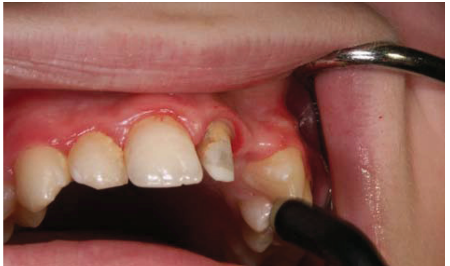
Slika 1. Rekonstrukcija ekstraradikularnog dijela bataljka, pogled s vestibularne strane

Mehanička svojstva zuba opskrbljenog intraradikularnim kolčićima ovise o gradivnom materijalu kolčića (kompozitni i metalni kolčići imaju značajno različite module elastičnosti). Smatra se da oni kolčići kod kojih je modul elastičnosti sličniji dentinu imaju bolja biomehanička svojstva, a takva obilježja pokazuju upravo kompozitni kolčići (3). Lanza i sur. (4) su 2005. testirali na okluzalno opterećenje čelične, karbonske i kompozitne kolčiće cementirane u korijenski kanal te dokazali da kruti sustavi (npr. metalni i karbonski kolčići) djeluju protivno prirodnoj funkciji zuba stvarajući područja naprezanja i loma u dentinu i području kontakta svezujućeg sredstva i kolčića. Naprezanje kod statičkog opterećenja ne doseže granicu do loma dentina i cementa. Utjecaj elastičnosti cementnog sloja na redistribuciju naprezanja manje je relevantan u situaciji kad se povećava fleksibilnost kolčića. Maksimalne vrijednosti opterećenja kretale su se od 7,5 MPa (mega paskala) za čelične, 5,4 do 3,6 MPa za karbonske i 2,2 MPa za staklene kolčiće (4). Očuvanje i rekonstrukcija jako oslabljenih endodontski liječenih zuba ponekad je težak i nepredvidiv posao. Istraživanje distribucije sila kod oslabljenih korijena restauriranih titanskim kolčićima, primjenom različitih cemenata, pokazalo je da važnu ulogu za