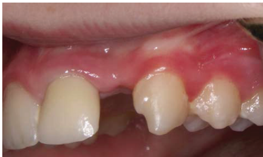
Slika 6. Cementirana krunica

uspjeh takve rekonstrukcije može imati i vrsta cementa. Istraživanje je pokazalo da je modul elastičnosti cementa kojim je cementiran intrakanalni kolčić važan parametar za uspjeh takvog tipa rekonstrukcije endodontski liječenih zuba. S povećanjem modula elastičnosti cemenata od 1,8 GPa do 22,4 GPa, naprezanje u dentinu se smanjivalo od 39,58 MPa do 31,43 MPa. Utvrđeno je da cementi s modulom elastičnosti sličnim dentinu mogu ojačati oslabjeli korijen zuba i smanjiti naprezanje u dentinu pa stoga mogu biti dobar izbor u rekonstrukciji oslabjelih korijena zuba u kliničkoj praksi (5). Istraživanje retencijske snage različitih cemenata kojim su cementirani kolčići u korijenskom kanalu nije pokazalo postojanje značajnih razlika (6). Testirani su komercijalni titanovi i lijevani zlatni kolčići koji su bili cementirani cink fosfatnim i kompozitnim cementom (Panavia F). Vlačna čvrstoća obaju cemenata bila je podjednaka. Rely XTM, korišten u ovom slučaju je samostvrđavajući staklo-ionomerni cement, i sastoji se od fluoraluminosilikatnog stakla i otopine modificirane polialkenske kiseline.