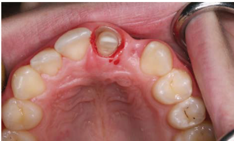
Slika 4. Rekonstrukcija ekstraradikalnog dijela bataljka, pogled s okluzalne strane