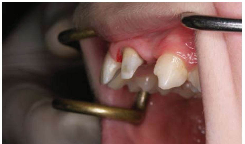
Slika 3. Rekonstrukcija ekstraradikularnog dijela bataljka anterio-posteriorno.