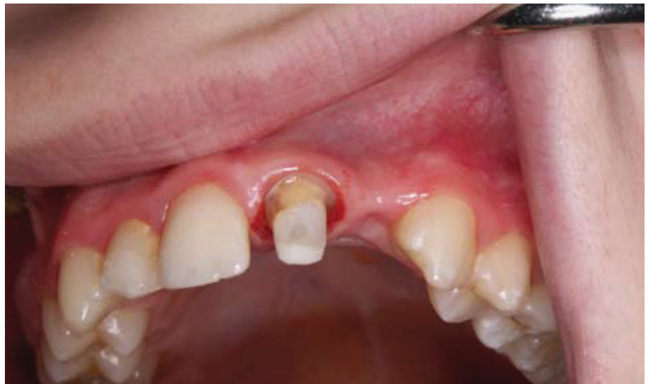
Slika 2. Rekonstrukcija ekstraradikularnog dijela bataljka