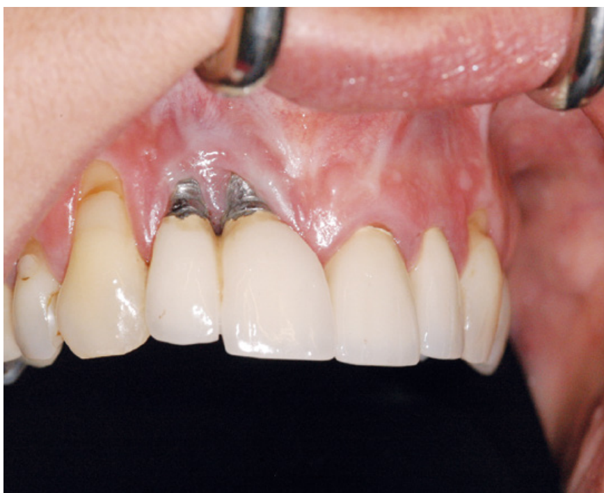
Slika 1. Prikaz loše zacijeljelog tkiva s posljedičnom recesijom gingive. Preuzeto s: http://www.dentalimplantsbirmingham.com/dental-implant-problems-2

[1] studentica 3. godine [2] Klinički zavod za oralnu kirurgiju, Stomatološki fakultet Sveučilišta u Zagrebu, Klinička bolnica Dubrava