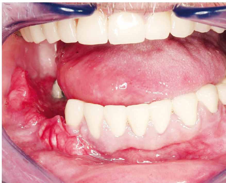
Slika 3. Planocelularni karcinom koji zahvaća gingivu manibule u regiji 42-47. Preuzeto iz (7).

mora biti u stanju ocijeniti je li pacijent podoban za provedbu zahvata. Kronični pušači koji nemaju kontrolu nad svojom ovisnošću, a k tome ne održavaju redovito higijenu, apsolutna su kontraindikacija za provedbu terapije. Kod pušača koji održavaju zadovoljavajuću oralnu higijenu i sposobni su na neko vrijeme apstinirati od cigarete zbog potreba terapije, potrebno je provesti periimplantološki protokol apstinencije – 1 tjedan prije i 8 tjedana nakon implantacije potrebno je apstinirati od pušenja. Tako se omogućuje nužno cijeljenje tkiva, bez izravnih štetnih utjecaja duhanskog dima na otvorenu ranu. Mnogim pacijentima pušačima ugradnja dentalnog implantata može biti dobra prilika da se potpuno odviknu od pušenja. Također, dokazano je da bivši pušači imaju manji rizik za neuspjeh terapije od sadašnjih pušača. Prestanak pušenja rezultira poboljšanim parodontnim zdravljem te povećava šanse za uspješnu implantaciju (8). Kliničko iskustvo pokazuje da je, usprkos poražavajućim rezultatima istraživanja o povezanosti pušenja i implantacije, puno bitnija stavka pacijentova redovita oralna higijena i suradnja sa stomatologom. Ukoliko pacijent pokaže volju i odlučnost da svoju pušačku naviku makar na kraće vrijeme podredi uspjehu implantološke terapije, velike su šanse za uspjeh iste. fi