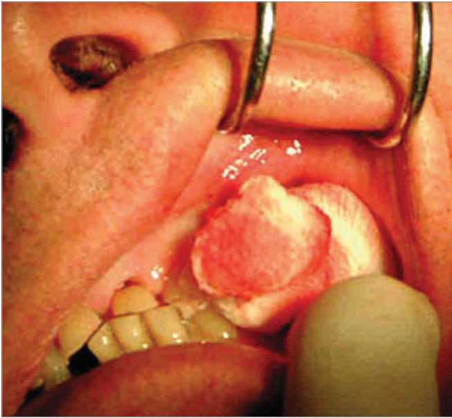
Slika 3. Vanjska kompresija ekstrakcione alveole gazom natopljenom otopinom Cyklokaprona