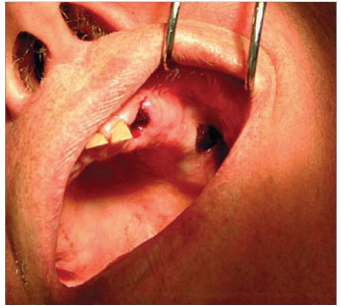
Slika 4. Kontrola krvarenja pola sata nakon ekstrakcije kod pacijenata na marivarinskoj terapiji

zama (terapija visokog intenziteta) daje se pacijentima s umjetnim srčanim zaliscima ili za prevenciju ponovnog miokardijalnog infarkta. Preporučena INR vrijednost za pacijente na terapiji niskog intenziteta je 2.5 u razmjeru od 2.0 do 3.0. Za pacijente na terapiji visokog intenziteta antikoagulacije vrijednost INR je 3.0 s razmjerom od 2.5 do 3.5 (5).