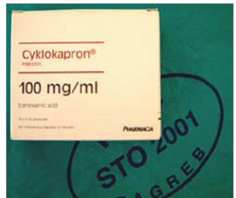
Slika 2. Injekcijska otopina Cyclokaprona koja se koristila za ispiranje usta

Warafin je antagonist vitamina K koji oslabljuje jetrenu sintezu koagulacijskih faktora II, VII, IX i X i endogenog proteina C i S djelujući na intrinzični i ekstrinzični put koagulacije, rezultirajući oštećenjem formiranja fibrina. Oralni antikoagulansi poput warfarina koriste se prvenstveno u profilaksi i liječenju venske tromboze i za prevenciju sistemskog embolusa sa srcem kao njegovim izvorom.