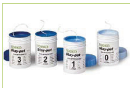
Slika 2. Primjer retrakcijskih končića