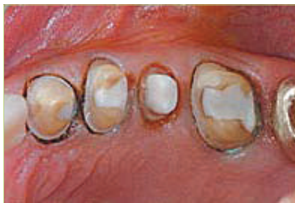
Slika 5. Izgled nakon uklanjanja Expasyla

Ako se ne pridržavamo pravila rada i ostavimo hemostatik predugo u sulkusu, može doći do ireverzibilnog efekta u vidu poremećaja cirkulacije i ishemijskog oštećenja tkiva. Rezultat je gingivna recesija, koja je jače izražena ako je tkivo već prethodno upaljeno (gingivitis, parodontitis). Sve tehnike uzrokuju privremenu upalu u tkivu gingive. Najveću upalu i najspornije smirenje uzrokuje materijal Expasyl, a moguća je i pojava preosjetljivosti (8). Napomena: slabija krvarenja kod bla-