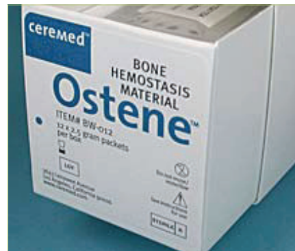
Slika 12. Ostene

nakon ekstrakcije, i naknadno krvarenje (sekundarno), uslijed infekcije u alveoli odnosno gingivi. U takvim slučajevima indicirano je uspostaviti hemostazu umjetnim putem.