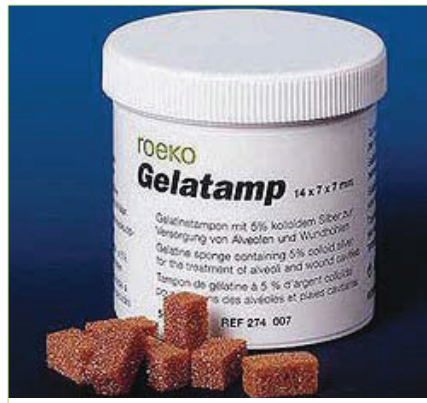
Slika 8. Gelatamp spužvice

Teško je procijeniti jesu li te reakcije posljedica straha ili primijenjenog vazokonstriktora uz lokalni anestetik. Reakcije su blage i prolaze bez terapije. Upotreba lokalnog anestetika s adrenalinom kontraindicirana je u pacijenata s feokromocitomom, nekontroliranim hipertireoidizmom, nekontroliranim dijabetesom, nekontroliranim kardiovaskularnom bolesti, zatim pri osjetljivosti na sulfite te u pacijenata s astmom pod kortikosteroidnom terapijom. Simptomi predoziranja vazokonstriktorom su palpitacije, aritmija, ubrzan puls, porast krvnog tlaka, glavobolja, vrtoglavica, nemir. U takvim situacijama potrebno je sniziti krvni tlak (alfa blokator Chlorpromazin 50 do 100 mg iv.) te smanjiti tahikardiju i uzbuđenje (beta blokator Propranolol 0,5 do 1,0 mg iv.) (15).