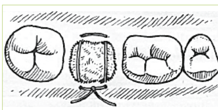
Slika 7. Fiksiranje "madrac" šavom

Neki pacijenti na injekciju lokalnog anestetika reaguju bljedilom, znojenjem, tahikardijom, mučninom i gubitkom svijesti.