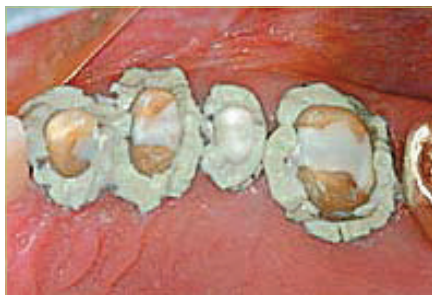
Slika 4. Expasyl apliciran u sulkuse

Roeko). Rolice je moguće upotrijebiti i kod končića za njihovo bolje pozicioniranje i održavanje u sulkusu. Pri uzimanju otisaka izvrsni rezultati postižu se kombinacijom končića i ekspandirajućih hemostatika (7). Primjeri ekspandirajućih preparata su Expasyl (Kerr), Magic FoamCord (Coltène/Whaledent), GingiTrac(Centrix) (slika 4, 5) itd.