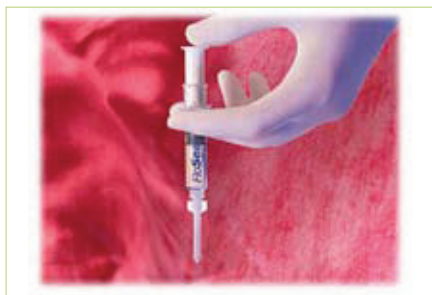
Slika 10. FloSeal aplikator