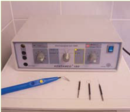
Slika 13. Elektrokauter

u prevenciji postekstrakcijskog krvarenja u pacijenata koji primaju varfarin a čiji je INR (international normalised ratio) u terapijskim granicama (2-3.5) (18).