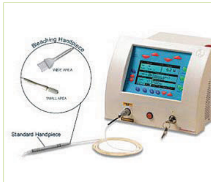
Slika 14. Laser

Osim u kontroli gingivnog krvarenja, željezov sulfat upotrebljava se i u kirurgi-