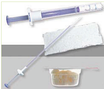
Slika 11. Avitene aplikator