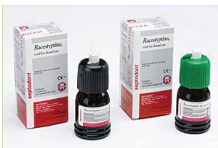
Slika 1. Racestypine otopina

U novije vrijeme pojavljuju se i tzv. ekspanzirajuće forme (vinil polisiloksan), koje ne samo da zaustavljaju tekućine, već ujedno svojim bujanjem i odmiču rub gingive od preparacije. Brzo i lako se stavlja u uklanjaju, nema zaostatnih kemikalija koje mogu interferirati kod uzimanja otiska ili vezanja kompozitnih materijala. Bitno je da se pri njihovoj primjeni vrlo rijetko inducira tkivna trauma koja može rezultirati krvarenjem, što se često događa kod aplikacije končića nepažljivim rukovanjem i prevelikim pritiskom (6). Na ekspanzirajuće materijale potrebno je ostvariti dodatni pritisak koji se postiže zagrizom u posebno oblikovane pamučne rollice (Comprecap,