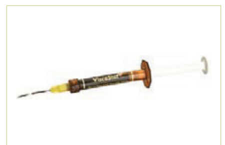
Slika 3. Aplikator gelatinoznog hemostatika