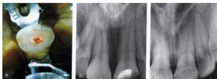
Slika 3. Djelomična pulpotomija po Cveku te uspješno cijeljenje dentinskim mostićem

Djelomična pulpotomija (pulpotomija po Cveku). Od uvođenja u kliničku praksu ovog postupka ranih osamdesetih godina, višestruko je potvrđena njegova vrijednost u terapiji pulpe mladog trajnog zuba. Indikacija za zahvat je ekspaniranje pulpe tijekom uklanjanja karijesne lezije. KomPLICIRANA fraktura krune također je indikacija za primjenu ovog postupka čak i ako prođe više od 24 sata od nezgode. Danas neki autori ovoj metodi daju prednost i pred klasičnim DPP-e jer osigurava prikladnije uvjete rada što posljedično rezultira boljim terapijskim uspjehom odnosno preživljenjem pulpe.