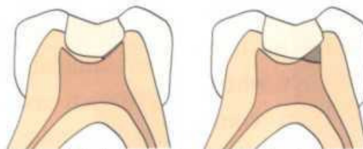
Slika 1.b i c Indirektno i direktno prekrivanje pulpe

Direktno prekrivanje pulpe kod mliječnih zubi postupak je koji nije indiciran odnosno indikacija je vrlo uska i svodi se na male otvore pulpe nastale tijekom uklanjanja karijesnog dentina. Stoga ovaj postupak treba izbjegavati tijekom liječenja pulpe mliječnih zubi zbog vrlo niskog postotka uspješnosti. (Slika 1.b i c)