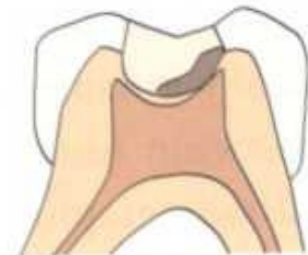
Slika 1.a Shematski prikaz postupne ekskavacije karijesa (stepwise excavation)

Indirektno prekrivanje pulpe (IPP) najblaži je zahvat na pulpi koji slijedi nakon uklanjanja karijesnog dentina. Materijal izbora za indirektno prekrivanje pulpe jesu jednokomponentni i dvokomponentni preparati na bazi Ca-hidoksida, a uvjetno to mogu biti i stakleni ionomeri. Tehnika koja se ovdje preporučava je višekratno čišćenje karijesa uz tretman Ca-hidroksidom između posjeta ("postupna ekskavacija ili stepwise excavation"). Ovakav postupak ima za svrhu prvenstveno osigurati uvjete za "oporavak" pulpe nakon iritacije tijekom karijesnog procesa te fizikalnih i kemijskih iritansa koji nastaju tijekom zahvata na tvrdim zubnim tkivima. Ovakav postupak dobar je i iz psiholoških razloga jer ga pacijenti lakše podnose. Ako se odluči završiti terapiju definitivnim ispunom u jednom posjetu na eksponirani dentin svakako treba staviti zavoj od dvokomponentnog Ca-hidroksidnog cementa. (Slika 1.a)