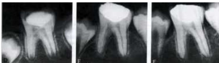
Slika 2 Uspješno direktno prekrivanje pulpe te završetak rasta i razvoja korijena

Direktno prekrivanje pulpe (DPP). Za razliku od mlječnih zubi, kod mladih trajnih zubi direktno prekrivanje pulpe je indiciran klinički postupak. Primjenjuje se kod malih trepanacijskih otvora nastalih iz različitih razloga, od akcidentno otvorene pulpe tijekom uklanjanja karijesno promjenjenog dentina do traumom eksponirane pulpe. Klinički postupak je takav da se na zdravu, patološki nepromijenjenu pulpu koja u trenutku izlaganja ne krvari profundno primjenjuje jedno ili dvokomponentni cement Ca-hidroksida, a zub se tretira privremenim ili definitivnim ispunom. Ako je dobro postavljena indikacija, a to je da zub ne boli spontano prije zahvata i da se krvarenje može učinkovito kontrolirati tijekom rada te je moguće osigurati aseptično radno polje (koferdam), prognoza ovog postupka je vrlo dobra. (Slika 2.)