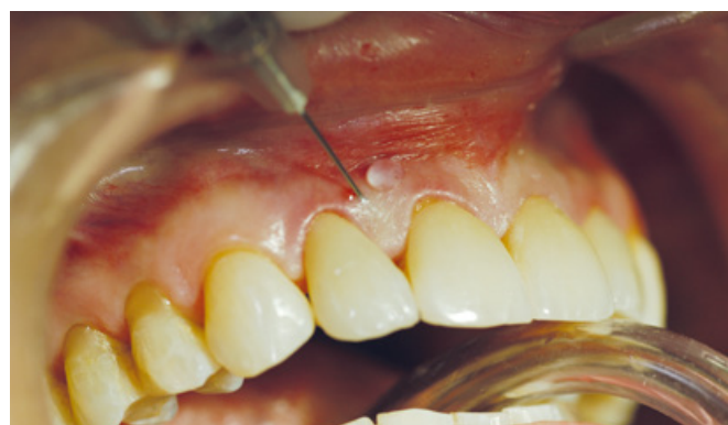
Slika 4. Gel hijaluronske kiseline se ubrizgava u područje pričrvene gingive, kako bi dobili povećanje volumena pričrvene gingive