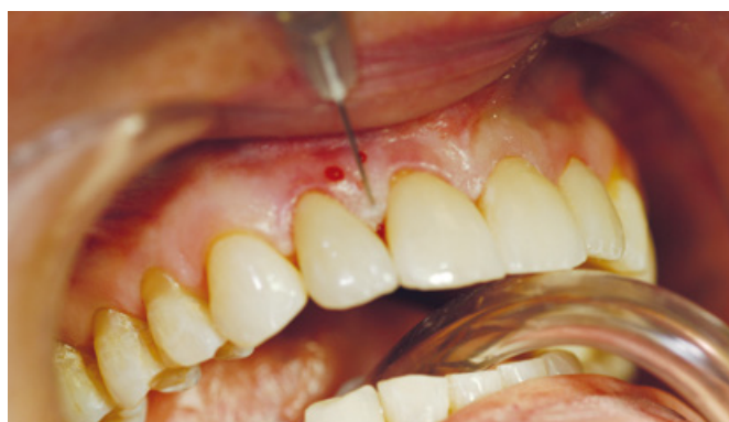
Slika 5. Gel hijaluronske kiseline ubrizgavamo 2 mm iznad najviše točke papile