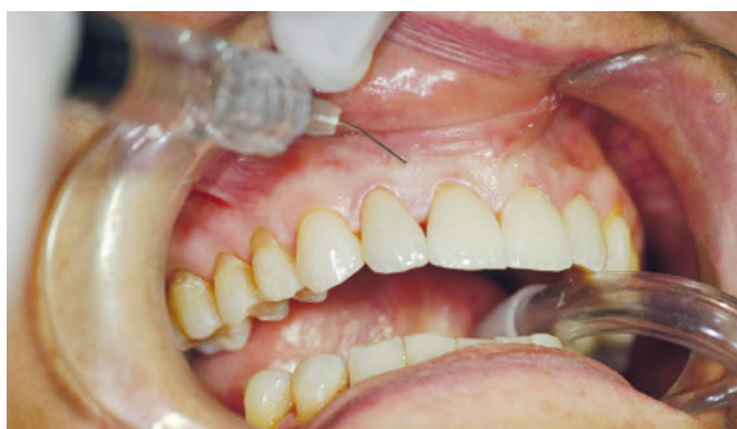
Slika 3. Gel hijaluronske kiseline se ubrizgava u područje alveolarne sluznice kako bi se stvorio stabilan temelj za regeneraciju mekog tkiva