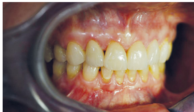
Slika 2. Početno stanje (klasa I gubitka aproksimalne papile, Norland i Tarnow)