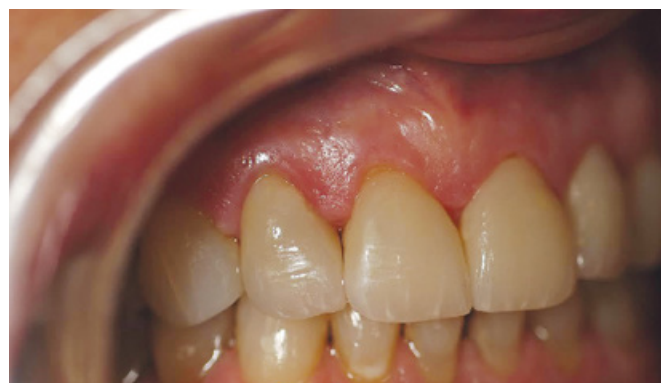
Slika 6. Prikaz tretirane aproksimalne papile nakon 3 tjedna od tretmana