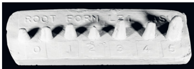
Slika 5. Pločica korijenski oblik, donji prvi pretkutnjak.