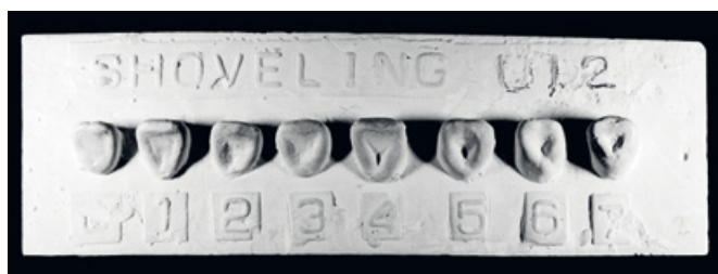
Slika 1. Pločica lopatasti zubi, gornji bočni sjekutić.