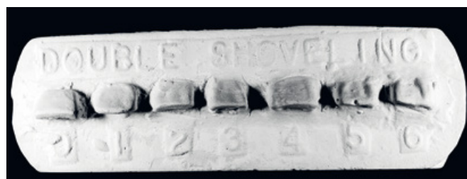
Slika 2. Pločica labijalno lopatasti zubi, gornji sjekutići.