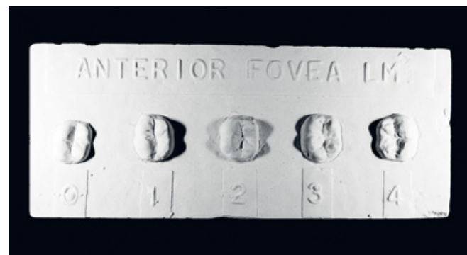
Slika 4. Pločica prednja jamica, donji prvi kutnjak.