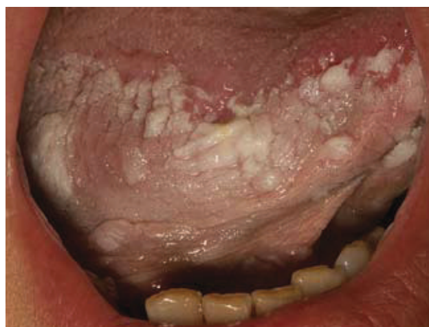
Slika 3. Nehomogena leukoplakija – nodularni podtip