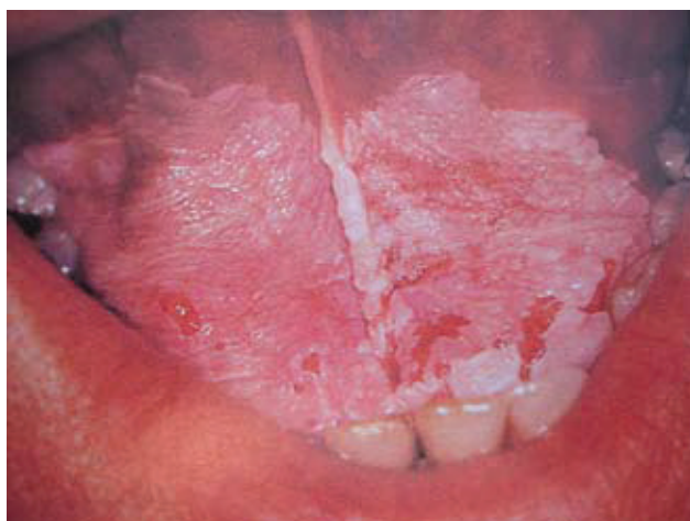
Slika 2. Nehomogena leukoplakija – erozivni podtip (preuzeto iz G. Laskaris "Atlas oralnih bolesti" prvo hrvatsko izdanje)

Imajući spomenutu definiciju na umu, u obradi pacijenta s lezijom suspektom na leukoplakiju, prvo treba odrediti i koliko je moguće, isključiti sve čimbenike koji mogu uzro-