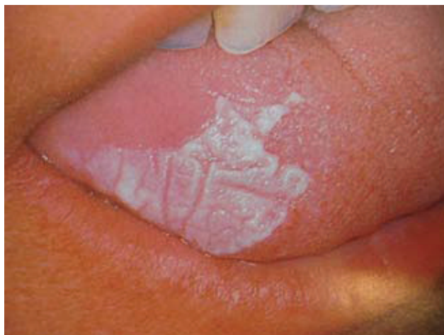
Slika 1. Homogena leukoplakija - lezija s glatkom površinom na kojoj su vidljive plitke pukotine (preuzeto iz G. Laskaris "Atlas oralnih bolesti" prvo hrvatsko izdanje)

Zavod za oralnu medicinu, Stomatološki fakultet Sveučilišta u Zagrebu