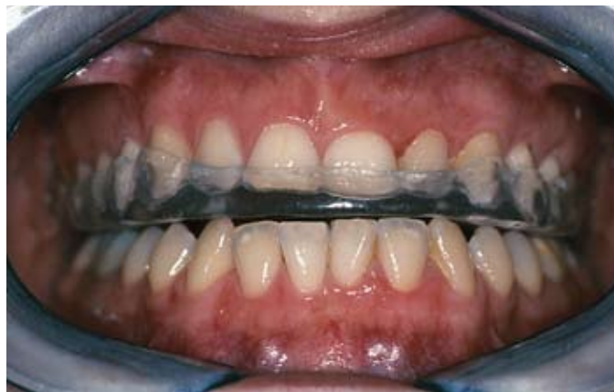
Slika 3b. Nova okluzijska udlaga u ustima pacijentice

buđenja bruksist imao stisnute zube, ili je njima škripao, može biti primjećen i noću tijekom buđenja, ali te su faze u spavanju teže zamjetljive, jer se odmah nastavlja slijedeći ciklus spavanja. U takvim trenucima netko u blizini može uočiti i potvrditi bruksističku aktivnosti noću. Tu se nezaobilazno u dobivanju potrebnih anamnestičkih podataka treba ući u sferu intimnog – partner pri spavanju dobar je svjedok da se poveže kauzalno noćni bruksizam i istošenost tvrdih zubnih tkiva. Naravno, osobna je stvar tko i kakvog partnera ili partericu ima pri sebi noć, ili uopće nema. Ako ništa drugo postoje susjedi – ostalom i hrkanje smeta uvijek nekome drugome samo je glasnije. U noćnom bruksizmu može se ogledati i psihičko raspoloženje osobe, a još više u pojavi dnevnog bruksizma. Naime, dnevni bruksizam, i to uglavnom stiskanje zubima, je gori oblik jer ne postoji za njega fiziološki razlog. U tom slučaju već i informiranost će doprinjeti da dnevni bruksist bude svjestan navika svojeg oralnog ponašanja. Aktivno sudjeluje u mjenjanju aktivnosti u trenutku dnevnog bruksizma, ako nesvjesno parafunkcioniranje uzrokovano psihičkom nape-tošću, pomoći će u, naročito kad takva parafunkcija stvara štetne posljedice na zdravlje zubni. Uvijek je pitanje kad će se utvrditi da li postoje posljedice bruksizma, a time i sama bruksistička aktivnost.