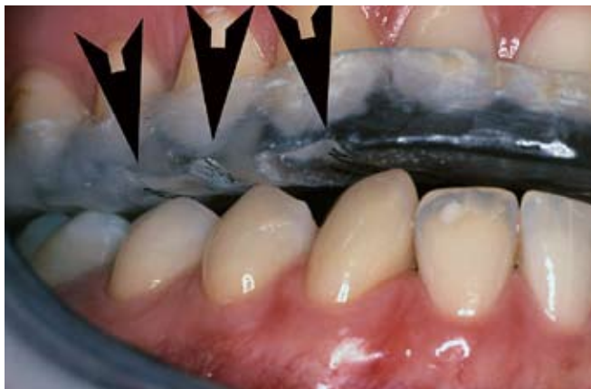
Slika 3a. Stara udlaga ima vidljive uzure kao posljedice istrošenosti zbog bruksizma