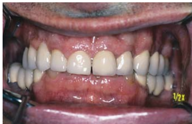
Slika 4a i b. Posljedice abrazije i atricije kod istog pacijenta, u patološkom trošenju zubi uzročnik je i antagonistički dodir keramike sa zubnom caklinom

sko ubušavanje te stvaraju preduvjeti za kasnijom protetskom terapijom. Udlaga temeljem centričnog registrata mijenja habitualne i potencijalno patološke okluzijske odnose, daje impuls mijenjanju naučenih obrazaca djelovanja žvačnih mišića, relaksira antagonističke mišićne skupine te djeluje na odterćenje unutar-zglobnih struktura čeljusnog zgloba i pozicioniranje kondila u terapijski položaj. Ukratko, cilj udlage je mijenjanje oralne funkcije koja u svim segmentima niti nije u potpunosti znanstveno potvrđena, a s ciljem ublažavanja ili potpunog uklanjanja tempromandibularnih bolova.