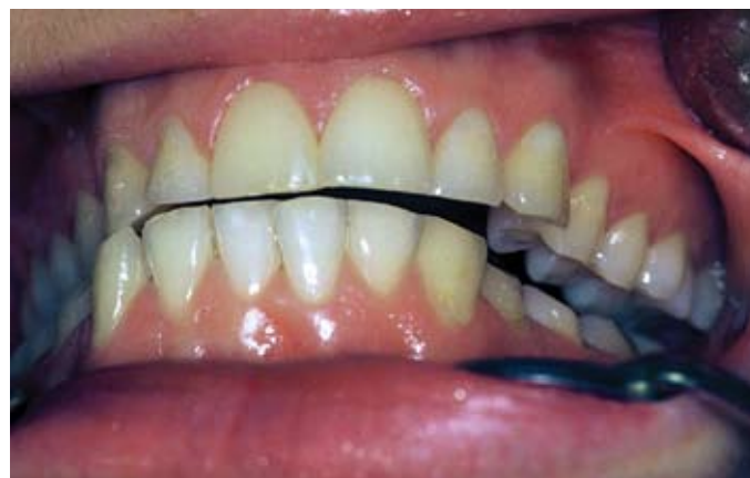
Slika 2. Brusne fasete govore o dominantno ekscentričnom tipu bruksizma (škripanje zubima)