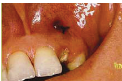
Slika 7. Cjevčica dodatno učvršćena šavom