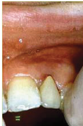
Slika 1. Izgled vestibularne sluznice iznad zuba 22

Ono što je jedinstveno u terapiji upala endodontskog porijekla je da terapiju započnemo liječenjem endodontskog prostora ili uklanjanjem zuba. To, naravno, ovisi o budućem planu rehabilitacije žvačnog sustava. Uz endodontsko liječenje, po potrebi paralelno ili nakon nekog vremena se provode i zahvati endodontske kirurgije. Standardni koraci su dizajn režnja, fizički