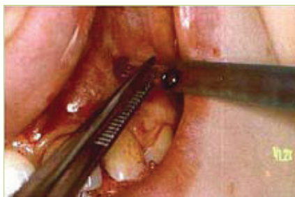
Slika 5. Umetanje pripremljene polietilenske cjevčice malog promjera