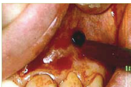
Slika 8. Ispiranje šupljine fiziološkom otopinom pomoću igle i šprice