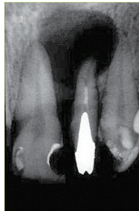
Slika 2. Nedovoljno punjen korijenski kanal u kojem se nalazi lijevana nadogradnja. Vidi se periradikularni nestanak kosti