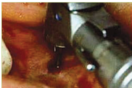
Slika 4. Čeličnim svrdlom se prodre kroz kost do lumena šupljine