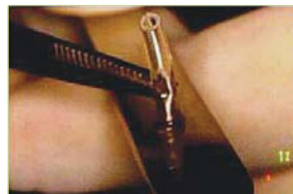
Slika 6. Izrada proširenja na cjevčici koje sprječava upadanje cjevčice u lumen šupljine

pristup mjestu lezije te uklanjanje patološkog tkiva, moguće poticanje rasta kosti biološkim usadcima i bio membranama.