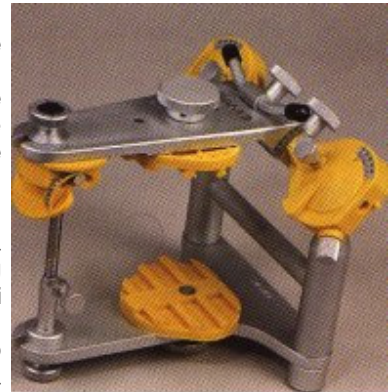
Slika 2. Poluprilagodljivi artikulator SAM2

Poluprilagodljivi artikulatori (Slika 2) daju znatno više informacija za razliku od neprilagodljivih artikulatora jer osim bilježenja okluzijskog kontaktnog položaja, vrlo vjerno simuliraju kretnje donje čeljusti. Sposobni su reproducirati smjer i krajnju točku, ali ne i intermedijatnu putanju kondilnih kretnji. Na primjer, nagib putanje kondila prikazuje se kao ravna linija kod mnogih artikulatora iako se ustvari radi o zakrivljenoj putanji. U mnogo instrumenata, lateralna translacija ili Bennettova kretnja prikazana je kao ravna linija koja stupnjevito odstupa, premda neke novije izvedbe artikulatora imaju prilagođenu neposrednu