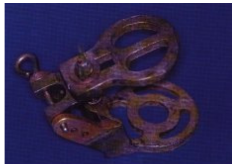
Slika 1. Neprilagodljivi artikulator - okludator

Neprilagodljivi artikulatori (okludatori) su najjednostavniji tip artikulatora (Slika 1). Jedini položaj koji mogu simulirati ovi artikulatori je interkuspidacijski položaj. Kada se modeli gornje i donje čeljusti montiraju u tom položaju u neprilagodljivi artikulator mogu se ponovno odvojiti i zatvoriti samo u tom položaju. Interkuspidacijski položaj nije moguće vjerno ponoviti ako su modeli montirani u povišenoj vertikalnoj dimenziji. Ovaj mali instrument ima sposobnost simulacije čiste rotacije prilikom početnog otvaranja usta ( 20 \pm 5 mm), dok nije u mogućnosti simulirati translacijske kretnje. Udaljenost između zubi i osi rotacije koja prolazi kroz čeljusne zglobove značajno je kraća u artikulatoru nego u pacijentovim ustima. Drastična razlika između radijusa zatvaranja u artikulatoru i u pacijentovim ustima stvorit će pogrešku koja će utjecati na netočno oblikovanje morfoloških osobina kvržica, grebena i udubina okluzijske površine. Rezultat rada s neprilagodljivim artikulatorom je gubitak točnosti koji se najčešće manifestira pojavom preranih okluzijskih dodira na neradnoj strani na gotovom protetskom radu. Prema tome, ovaj tip artikulatora ima vrlo malu praktičnu vrijednost jer ne može simulirati položaje i kretnje donje čeljusti i čeljusnih zglobova. Nažalost, još i danas se često primjenjuju u svakodnevnoj praksi (6,10).