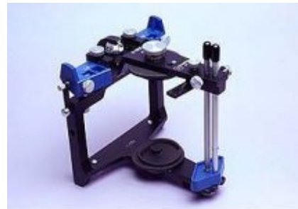
Slika 5. Potpuno prilagodljivi artikulatur Panadent 1901 AR Model SH

Instrument koji najtočnije reproducira kretnje i položaje donje čeljusti odnosno čeljusnih zglobova je potpuno prilagodljivi artikulatur (Slika 5). Ovi sofisticirani instrumenti dizajnirani su tako da sasvim izvode granične kretnje donje čeljusti, što uključuje neposredni i produženi pomak kondila u stranu za vrijeme lateralne translacije, te krivulju i smjer nagiba kondila (7). Precizne kretnje kondila specifične za svakog pacijenta ovi artikulaturi mogu izvesti samo ako su namiješteni slijedeći parametri: