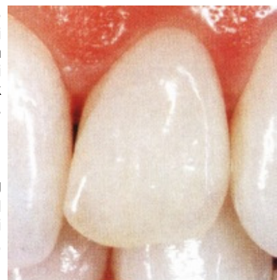
Slika 5. Potpuna keramička krunica na gornjem bočnom sjekutiću (tehnika slojevanja ili napečivanja)

Keramička sirovina za ovu tehnologiju unaprijed je izrađena u obliku malih valjičića, različitih s obzirom na zahtjevanu boju i transparentiju. U posebnoj peći koja je razvijena za ovu metodu, valjičići su "rastopljeni" kod temperature 1100 °C i tlaku 5 bara keramička sirovina je utisnuta u pripremljeni oblik. Za razliku od lijevanja kovine, kod ove keramike ne dolazi do taljenja, nego do stvaranja plastične konzistencije.