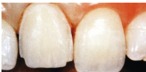
Slika 10. Preparacija središnjeg sjekutića za keramičku estetsku ljusku

Potpunokeramički nadomjestci trebali bi biti cementirani pomoću translucenatnog, rahlo obojanog (u boji zuba), dualno stvrdnjavajućeg (svjetlosno ili kemijski) kompozitnog cementa. Da se spriječi postoperacijska osjetljivost upotrebljava se adhezijski sustav, minimalno četvrte generacije koji će zabrtviti dentinske tubuluse. Za postizanje maksimalne sile svezivanja unutarnja je površina keramičkog nadomjestka unaprijed pjeskarena ili jetkana te nakon toga silanizirana. Razlog uporabe kompozitnog cementa je s jedne strane estetski, a s druge fizičko-mehanički jer povećava čvrstoću