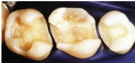
Slika 12. Preparacija na molarima za inlay i onlay

Na Stomatološkom fakultetu u Zürichu rađena su vrlo objektivna klinička zapažanja potpunokeramičkih nadomjestaka i svi objavljeni radovi sadržavali su pregledne studije. Svaka od potpunokeramičkih rekonstrukcija bila je temeljito spitana pomoću stomatološkog zrcala i sonde, te rendgenom i uporabom silikonskog otiska. Godine 1992. objavljeni su prvi rezultati stanja potpunokeramičkih nadomjestaka nakon tri godine. Postotak održanja kod inlaya i onlaya bio je 98% a kod potpunokeramičkih krunica 95%. Rezultati