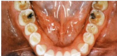
Slika 16. Pogled na izgled zuba prije provedene operacije

aspekta, ta je metoda jednakovrijedna tehnici prekrivanja slojeva. Od 1993. godine pri uporabi bojajuće tehnike, moguća je nabava sirovog, minimalno bojanog keramičnog materijala (TC1-TC5, Ivoclar/Williams, Amherst, NY).