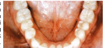
Slika 17. Dvije godine nakon liječenja (donja čeljust): 14 potpunokeramičkih nadomjestaka (djelomične krunice, keramičke fasete, onlayi)

Uporaba adhezijskog sustava različita je kod potpunokeramičkih nadomjestaka i kod neposrednih kompozitnih ispuna. Kod potonjih, prvi je korak nanošenje adhezijskog sustava i polimerizacija pomoću plavog monokromatskog svjetla. Drugi je korak primjena kompozitnog materijala, u slojevima te njegovo stvrdnjavanje odn. polimerizacija. Kod cementiranja keramičkih nadomjestaka, adhezijski sustav se ne polimerizira jer se tako sprečava promjena reljefa površine preparacije sa nepredvidljivom debljinom slojeva nesavrtljivog adheziva, uključujući sa prodiranjem u kutove (efekt bazena), nego se adheziv polimerizira s kompozitnim cementom. Sloj cementa može biti deo i do 100 µm, a posljedica toga je nepreciznost i nemogućnost potpune adaptacije nadomjestka.