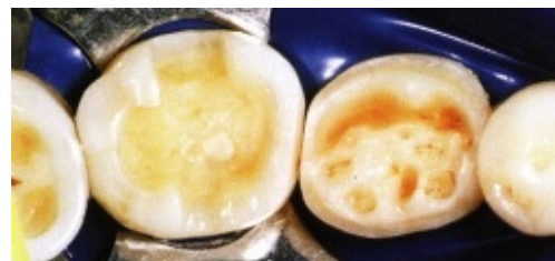
Slika 19. Preparacija za djelomične krunice (minimalan gubitak cakline i dentina)

Veliki broj publikacija govori o "perfektnom" rubu kao uvjetu za dugoročan uspjeh adhezivno cementiranog keramičkog nadomjestka. Na koji način tzv. "perfektni" rub dugoročno utječe na klinički uspjeh, još uvijek je predmet polemike.