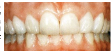
Slika 15. Dvije godine nako liječenja: 26 potpunokeramičkih nadomjestaka. Slojevanje keramike bilo je upotrebjeno samo u gornjem frontalnom području

Djelomična preparacija za keramičke fasete, djelomične krunice i onlaye, odvija se s težnjom štednje tvrdog zubnog tkiva. Tako se izbjegava kasnija pojava većine problema povezanih s endodontskim i parodontalnim komplikacijama koje su rezultat neadekvatne preparacije.