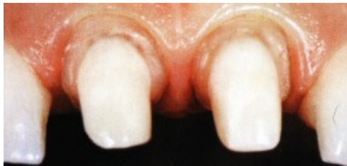
Slika 8. Stepeničasta cirkularna preparacija, idealna za potpunokeramičke krunice

preostalom zubnom tkivu te u keramičkom nadomjestku.