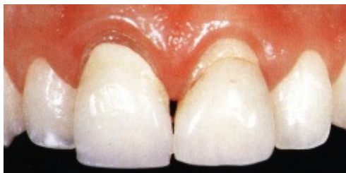
Slika 1. Gornji frontalni zubi prije liječenja

Jedna od glavnih zadaća stomatoloških istraživanja je traženje estetskih (prirodnom zubu sličnih) bezkovinskih materijala za obnovu oštećenog ili nadoknadu manjkavoga zuba. Zbog estetike i stabilnosti u tu se svrhu već desetljećima upotrebljava keramika. Trajnost većine potpunokeramičkih sustava je nezadovoljavajuća s obzirom na prirodnu krhkost materijala i baš su frakture zuba glavni razlog za visoki stupanj neuspjeha, ako uzmemo u obzir nedovoljno prilagođenu keramiku za nadomjestke u ustima. Od 1988. godine je Dental School, University of Zürich (Stomatološki fakultet Sveučilišta u Zürichu), u Švicarskoj počeo raditi s potpunokeramičkim sustavom IPS EMPRESS (Ivoclar/Williams, Amherst, NY). Ovaj članak sažeto želi prikazati kliničke i istraživačke rezultate od otprilike tri tisuće tada izrađenih keramičkih rekonstrukcijskih nadomjestaka.