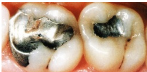
Slika 6. Amalgamski ispuni na molarima

Nakon "odlijevanja" i hlađenja nadomjestka, postoje dvije mogućnosti daljnjeg postupka. U slučaju da je nadomjestak bio modeliran u konačnom obliku i veličini, potrebno ga je samo dobojiti i glazirati. U slučaju da se iz ove posebne keramike odljeva samo "kapljica", daljnji radni postupak identičan je postupku napečavanja keramike na kovinsku konstrukciju.