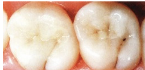
Slika 7. Potpuno keramički inlayi na molarnima - pet godina nakon liječenja

Potpunokeramički nadomjestci trebali bi biti cementirani pomoću translucenatnog, rahlo obojanog (u boji zuba), dualno stvrdnjavajućeg (svjetlosno ili kemijski) kompozitnog cementa. Da se spriječi postoperacijska osjetljivost upotrebljava se adhezijski sustav, minimalno četvrte generacije koji će zabrtviti dentinske tubuluse. Za postizanje maksimalne sile svezivanja unutarnja je površina keramičkog nadomjestka unaprijed pjeskarena ili jetkana te nakon toga silanizirana. Razlog uporabe kompozitnog cementa je s jedne strane estetski, a s druge fizičko-mehanički jer povećava čvrstoću