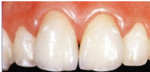
Slika 2. Nakon liječenja s potpunokeramičkim krunicama (s metodom slojevanja ili napečivanja)

Godine 1988. na Stomatološkom fakultetu u Zürichu uspješno su iskušali novi potpunokeramički sustav IPS EMPRESS. Objavljene trogodišnje studije i klinički rezultati nakon četiri godine su bili ohrabrujući. Inlayi i potpunokeramičke krunice su se u očekivanom razdoblju održale u 95% slučajeva (Slike 6-9)