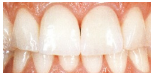
Slika 9. Središnji sjekutići sanirani potpunokeramičkim krunicama (metoda slojeva ili napečivanja)

Potpunokeramički nadomjestci ponekada zahtijevaju drugačiju preparacijsku tehniku u usporedbi s tehnikama koje se upotrebljavaju kod zlatnih ili kovinsko-keramičkih nadoknada. Keramika je u svojoj biti krhka i nije ju moguće uspoređivati s rastezljivošću kovine. Zbog toga marginalna područja moraju biti preparirana na oštru stepenicu. Kod toga je potrebno osigurati jasnu preparacijsku granicu koja će biti k tome oštra i imati pravi kut između površine zuba i ravnine preparacije (stepenice). S time je optimalno osigurana stabilnost nadomjestka i zuba. Isto vrijedi pri preparaciji ruba za krunice, fasete, inlaye i onlaye. Unutarnji kutovi i rubovi su zaobljeni čime se odstranjuju opasna područja napetosti u