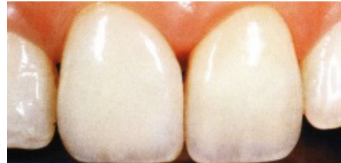
Slika 11. Središnji sjekić, 4 godine nakon cementiranja ljuske

Kod cementiranja keramičkih inlaya s povezivanjem keramike, kompozita i cakline nastaje dobro zatvaranje rubova. Otpornost tog kompleksa usporediva je s otpornošću prirodnog zuba. Keramički je inlay procesom cementiranja zadovoljavajuće poduprt što smanjuje njegovu podložnost za nastanak fraktura. Opasnost za postizanje kvalitetnu sveze keramike s tvrdim zubnim tkivom je vlažnost, odnosno rad u vlažnom radnom polju. Stoga je obavezna upotreba precizne izolacijske tehnike koja osigurava suho radno polje i to posebno kod inlaya drugog razreda.