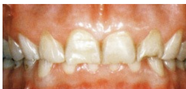
Slika 14. Gornji i donji zubi prije liječenja (en face). Abrazija i erozija bile su uzrok masovnog gubitka cakline i dentina

S obzirom na dugoročne pozitivne rezultate, upotrebljeni se materijal IPS EMPRESS preporuča za izradu keramičkih inlaya, onlaya, estetskih ljuski i potpunokeramičkih krunica u vidljivom području. Potpunokeramičke krunice u premolarnom i molarnom području nisu pokazale veći broj fraktura, što ne možemo reći za uporabu ostalih potpunokeramičkih sustava u ovom području.