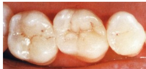
Slika 13. Cementirani keramički nadomjestak: inlay na molarima, te onlay

Na Stomatološkom fakultetu u Zürichu rađena su vrlo objektivna klinička zapažanja potpunokeramičkih nadomjestaka i svi objavljeni radovi sadržavali su pregledne studije. Svaka od potpunokeramičkih rekonstrukcija bila je temeljito spitana pomoću stomatološkog zrcala i sonde, te rendgenom i uporabom silikonskog otiska. Godine 1992. objavljeni su prvi rezultati stanja potpunokeramičkih nadomjestaka nakon tri godine. Postotak održanja kod inlaya i onlaya bio je 98% a kod potpunokeramičkih krunica 95%. Rezultati