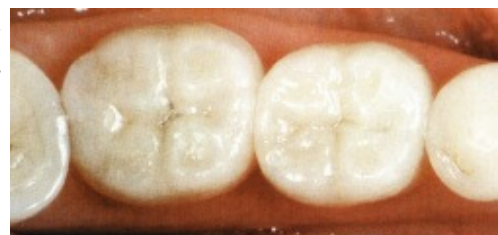
Slika 20. Isti slučaj nakon liječenja

Tamno pigmentirani korjenovi, posebice oni s nadogradnjama ili vijcima, vrlo su teška prepreka za postizanje optimalne estetike. Stoga se rabe nekovinske nadogradnje, koje omogućavaju prodor svjetlosti u korijen i paradont te tako ne bude očita siva sjena gingive. Za cementiranje nadogradnje potrebno je upotrebiti kvalitetan kompozitni cement koji je također dovoljno translucentan.