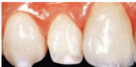
Slika 3. Gornji prednji sjekutić nakon liječenja s potpunokeramičkom krunicom

Keramički sustav IPS EMPRESS na tržištu je prvi put predstavljen 1990. godine kao nova alternativa za izradu potpunokeramičkih krunica, inlaya, onlaya i faseta. Leucitni kristali dugi 5µm, bili su u posebnoj okolini homogeno dispergirani u staklenoj fazi keramike. Zbog toga je bila obilježena kao "s leucitima oplemenjena staklo-keramika".