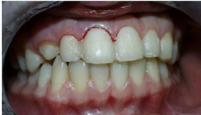
Slika 5. Kompozitna udlaga na reponiranom zubu sa slike 4

3. Istisnuće zuba (extrusio dentis) ili djelomična izbijenost zuba je klinički i radiološki očito izdignuće zuba iznad susjednih zubi s proširenom periodontalnom pukotinom. Krvarenje iz sulkusa gingive je uvijek prisutno. Perkusioni zvuk je tup. Terapija uključuje repoziciju istisnutog zuba i imobilizaciju kompozitnom udlagom kroz period od 2-3 tjedna.