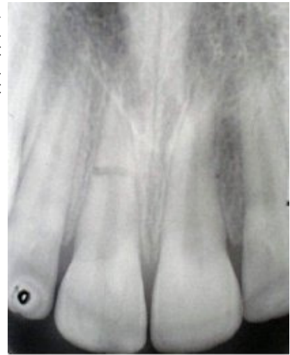
Slika 3. Prijelom korijena zuba 11