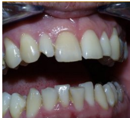
Slika 1. Infrakcija cakline na zubu 11 i nekomplirani prijelom krune zuba 12

Ozljede zubi se svrstavaju u dvije grupe; ozljede koje zahvaćaju tvrda zubna tkiva, i ozljede koje zahvaćaju potporne strukture zuba.