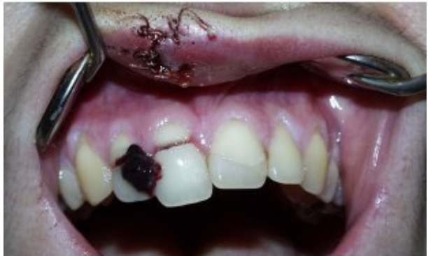
Slika 2. Komplicirani prijelom zubi 12, 11, 21 s krvnim ugruškom na zubu 12

Otvorenu pulpu treba zaštititi direktnim prekrivanjem kalcijevim hidroksidom ili učiniti pulpotomiju ili pulpektomiju.