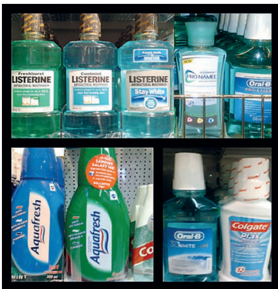
Slika 2. Oralni antiseptici, dostupni na našem tržištu, koji sadrže alkohol.

Zaključno, u iščekivanju novih rezultata dobro dizajniranih znanstvenih studija na temu uzročno - posljedične veze korištenja alkoholnih antiseptika i razvoja karcinoma, iste bi stomatolozi trebali propisivati kao i druge lijekove. Budući da oralni antiseptici koji ne sadrže alkohol imaju jednak antiseptički učinak kao i oni koji u svom sastavu sadrže alkohol, poželjno je pacijentima koji ih koriste svakodnevno, preporučiti antiseptike koji ne sadrže alkohol. Ukoliko postoji razlog za njihovo korištenje, alkoholni antiseptici bi se pacijentima trebali izdavati za kratkoročne terapijske situacije s jasno pisanim uputama o upotrebi.