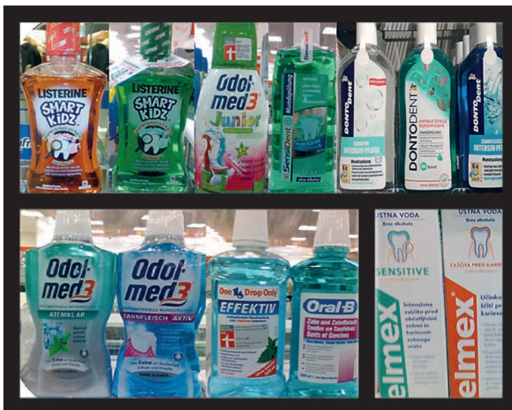
Slika 3. Oralni antiseptici, dostupni na našem tržištu, koji ne sadrže alkohol.