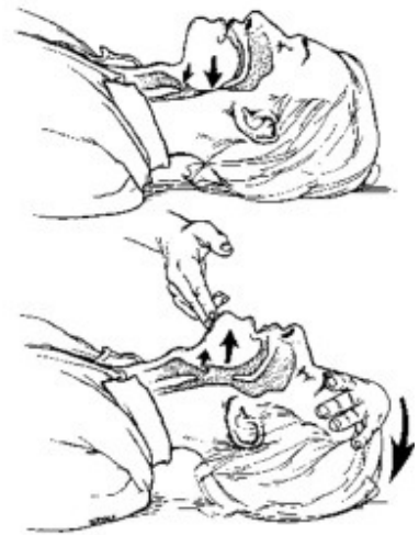
Slika 1. Oslobađanje gornjih dišnih puteva

U hospitalnim uvjetima hipotenzija se korigira i intravenskom primjenom fiziološke otopine 100ml/min, do ukupnog volumena od 3 litre u odraslih.