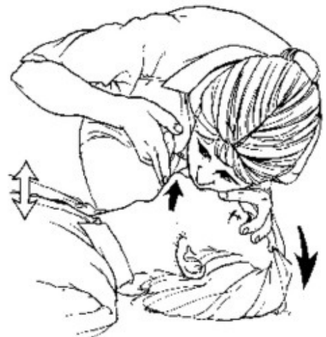
Slika 2. Umjetna ventilacija metodom usta na usta

Riječ je o reakciji koja se ne može sa sigurnošću razdvojiti o vazovagalne sinkope. Neki pacijenti na injekciju lokalnog anestetika reaguju bljedilom, znojenjem, palpitacijama, tahikardijom, mučninom i gubitkom svijesti. Simptomi zapravo prolaze sami od sebe, a terapija odgovara terapiji vazovagalne sinkope.