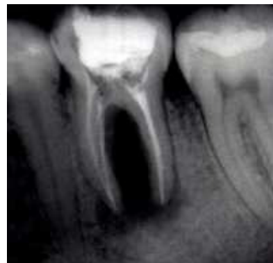
Slika 2. Poslije terapije

Prosječna širina dentinskih tubulusa u blizini pulpe iznosi 2,5 mm u promjeru, a na dentinsko- caklinskom i cementno- dentinskom spojištu 1 mm. Neprekinuti sloj cementa učinkovita je barijera prodoru mikroorganizama. Međutim, u slučajevima kongenitalnog nedostatka cementa koji bi prekrivao korijenski dentin, nakon odstranjenja cementa tijekom struganja i poliranja korijenske površine, ili usljed oštećenja tijekom traumatskih ozljeda, otvaraju se brojna mjesta komunikacije između zubne pulpe i parodontnog ligamenta. Teoretski, kroz dentinske tubuluse mogu prolaziti toksični metaboliti stvoreni tijekom pulpnih i parodontnih bolesti.(2,3)