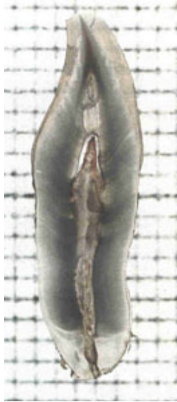
Slika 3. Izbrusak zuba za izračun dentalne dobi

I na kraju da zaključimo, brojne znanstvene studije na zubima i njihovi rezultati pokazali su da promatranje više parametara na zubu daje i kvalitetnije rezultate u odnosu na promatranje samo jednog obilježja. Uvijek je potrebno koristiti nekoliko postupaka za procjenjivanje dentalne dobi, a jedan od najboljih koji se nameće je postupak po Solheimu (za odraslu i stariju dob), odnosno atlas tehnika s promatranjem stupnja mineralizacije (za dječju dob). Kao potvrda tome idu u prilog i rezultati Identifikacijskog tima u Hrvatskoj te veliki broj postignutih identifikacija upravo na stvaranju dentalnog profila kao pripomoć u identifikaciji žrtava rata 1991.