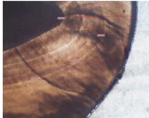
Slika 4. Inkrementne linije rasta u zubnoj caklini