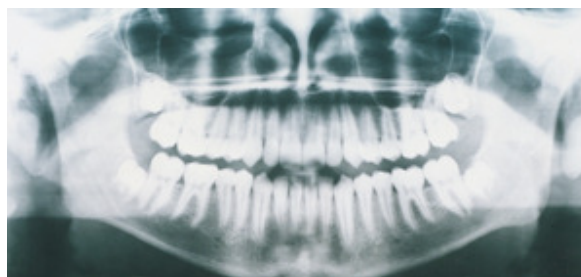
Slika 2. Ortopantomogram (praćenje dentalne zrelosti)