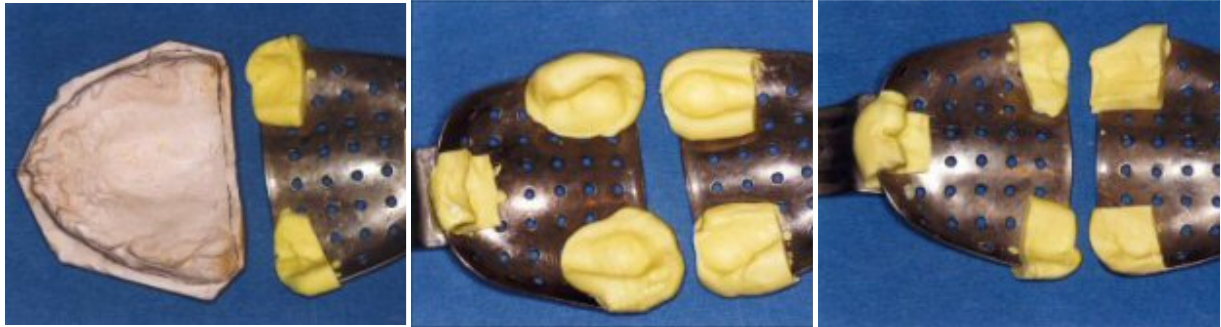
Slika 2: Stoperi u otisku neravnomjerno zacjeljene čeljusti nakon serijske ekstrakcije uvjetovane parodontopatijom