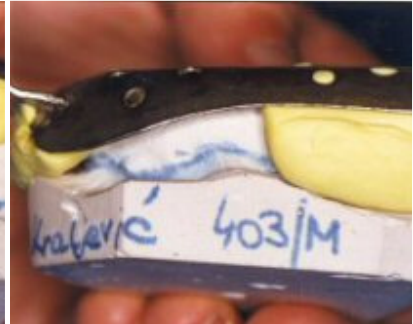
Slika 1c: Pravilnim smještajem stoper na žlici svojim vestibularnim rubom zahvaća naznačeni prijelaz u pomičnu sluznicu

Za praksu izvođenja stopera bitno je pravilno apliciranje u ustima. Neadekvatna debljina i slab pritisak kod aplikacije stopera često onemogućuju kasnije uzimanje otiska s alginatom. Previsoki stoperi još više udaljuju rub konfekcijske žlice od željenog područja prijelaza nepomične sluznice u pomičnu. U takvom slučaju bolje je ukloniti gumasti materijal i ponoviti stopere (Slika 1). Stoperi sprečavaju probijanje egzostoza u alginatu (Slika 2). Nakon uzimanja i stvrdnjavanja gumastog materijala potrebno je smanjiti stoper. Velikim otisnutim površinama stopera smanjuje se retencijska površina konfekcijske žlice. Krajnji posteriorni rubovi otiska u alginatu mogu se odvojiti, što je posljedica zatvaranja retencijskih otvora stoperima. Stopere je potrebno skalpelom izrezati na potrebnu površinu koja će služiti u aplikaciji alginata (Slika 3).