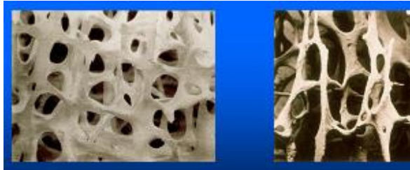
Slika 1. Normalna i osteoporotična kost

Već je odavno poznat utjecaj niske koncentracije 17- \beta -estradiola na gubitak kosti u žena u postmenopauzi, ali se i dalje istražuju promjene na alveolarnoj kosti uzrokovane istim padom E2. Dosad su napravljena tri istraživanja. Norderyd u svojoj studiji otkriva manji, ali ne i statistički značajan, gubitak pričvrstka u žena koje su primale HNT (hormonsku nadomjesnu terapiju) u usporedbi sa ženama bez HNT. U žena koje su primale HNT smanjeno je gingivno krvarenje. Jacobs u 5-godišnjoj studiji dokazuje da estrogen u HNT djeluje pozitivno na koštano tkivo mandibule. Konačno, Payne 1997. iznosi podatke o značajno nižim vrijednostima BMD-a alveolarne kosti žena s niskim estrogenom, u usporedbi s ženama koje su primale HNT i imaju viši BMD. Terapija estradiolom, u ranoj fazi osteoporoze, smanjuje upalu gingive i gubitak pričvrstka. Niska koncentracija estrogena dovodi do poremećene kontrole lučenja citokina što rezultira u povećanoj resorpciji kosti, niskoj gustoći alveolarne kosti i nastanku parodontne bolesti.