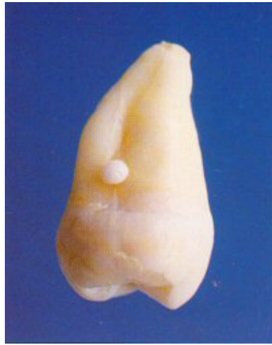
Slika 5: Jednostuki caklinski biseri na korijenima gornjih kutnjaka