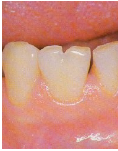
Slika 2: Jednostrano izražena geminacija donjeg bočnog sjekutića