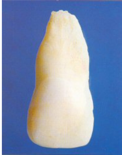
Slika 4: Potpuno stapanje prekobrojnog zuba s gornjim srednjim sjekutićem