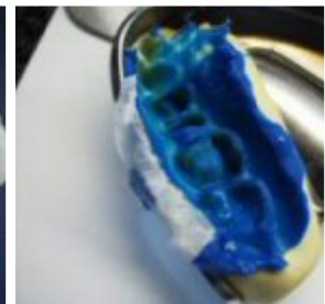
Slika 2: Parcijalni otisak čeljusti