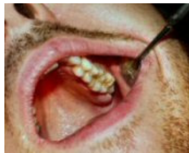
Slika 6: Kompozitni inlay skladno integriran u žvačni sustav

Usklađeni nadomjestak isproba se u ustima i priprema za cementiranje. Za cementiranje takvog nadomjeska najbolje je upotrijebiti kompozitni cement te pripremiti i zub i nadomjestak za tehniku adhezivnog cementiranja. Pri cementiranju uputno je upotrijebiti koferdam. Višak materijala kod cementiranja odstrani se vaterolicom i celuloidnom trakom, a rubovi nadomjestka prekriju se antioksidacijskim gelom koji sprečava stvaranje kisikom inhibiranog sloja i posljedične pukotine (Slika 5). Kod dualnih cemenata (svjetlosno i kemijski polimerizirajućih) stomatološkim svjetlom za polimerizaciju ubrzavamo polimerizaciju cementa.