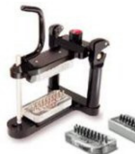
Slika 3: Postupak izrade kompozitnog inlaya u posebno prilagođenom artikulatoru i otiska uzetog bimaksilarnom žlicom

Ispun se izrađuje modelacijom na pripremljenom modelu standardnim stomatološkim instrumentima kojima bismo ispun izradili i direktno u ustima te pazeći na karakteristike boje i morfologije obližnjih zubi (Slika 4). Morfološka ploha modelira se prema susjedinim zubima ili/i u artikulatoru.