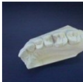
Slika 1: Kaviteti preparirani za kompozitni inlay

Otisak odlijevamo u super tvrdoj sadri (stone type IV sadra) u dvije kopije pazeći da se otisak ne ošteti prilikom vađenja modela iz otiska. Rubovi se kontroliraju i označava se granica preparacije. Kod uporabe bimaksilarnih djelomičnih žlica otisak se direktno sa jos svježom sadrom