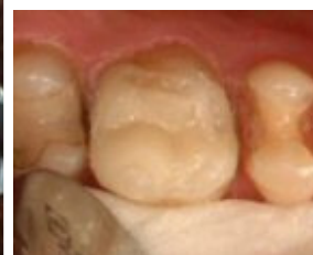
Slika 4: Kompozitni inlay u fazi isprobavanja na sekundarnom modelu