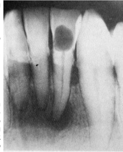
Slika 3. Radiološka potvrda interne resorpcije u cervikalnoj trećini krune zuba

Nekroza pulpe je odumiranje pulpnog tkiva koje nastaje kao konačan ishod neliječenog akutnog ili kroničnog pulpitisa ili traume kod koje dolazi do trenutnog prekida cirkulacije. Razlikujemo potpunu nekrozu kod koje je pulpno tkivo u cjelosti odumrlo, te djelomičnu kod koje postoje ostaci vitalnog pulpnog tkiva unutar nekih dijelova endodonta. Odumiranje pulpe je bezbolno sve dok se nekrotični materijal ne proširi preko apeksnog otvora u kost. Zbog toga zub kod potpune nekroze ne reagira na termičke podražaje i električni test vitaliteta. Ponekad jedini simptom može biti veća ili manja diskoloracija krune takvog zuba. Diferencijalno dijagnostički u obzir dolaze i traumatizirani, reponirani zubi, zatim zubi s nezavršenim rastom korijena i zubi kod kojih je došlo do pojačane klacifikacije zbog starenja. Kod takvih zuba inervacija može biti jako oslabljena ili čak u cjelosti prekinuta.