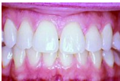
Slika 7. Zubni luk nakon završenog izbjeljivanja

Trajnost dobivene nijanse zuba varira između pacijenata, međutim smatra se da je potrebno izbjeljivanje povremeno ponoviti jer promjene nisu trajne. Također postojanje ispuna nalaže evaluaciju i zamjenu budući da vodikov peroksid u tako visokim koncentracijama ima degradirajuće djelovanje na kompozitne i staklenoionomernne materijale destruirajući matricu.