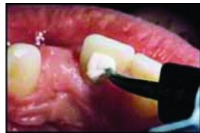
Slika 12. Aplikacija sredstva za izbjeljivanje nevitalnih zubi - Walking bleach