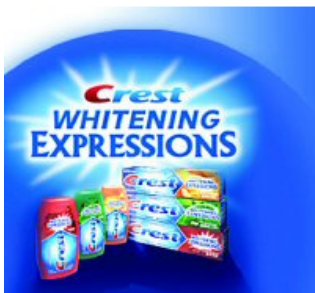
Slika 10. Zubne paste za izbjeljivanje

Iako postoje mnogi sustavi za izbjeljivanje sličnog sastava i djelovanja, za optimalan rezultat potrebna je suradnja pacijenta i terapeuta te vrlo pažljivo postupanje kako bi se spriječila pojava komplikacija.