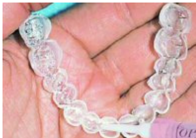
Slika 8. Matrica za izbjeljivanje kod kuće