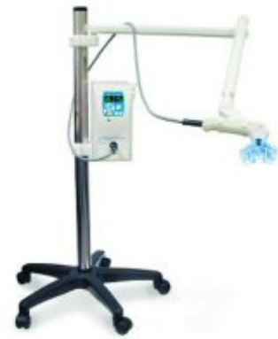
Slika 6. Aparat za osvjetljavanje i grijanje sredstva za izbjeljivanje (iluminator)