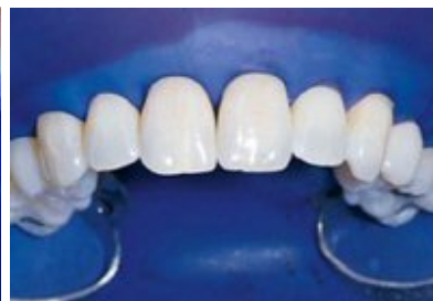
Slika 3. Postavljen koferdam za zaštitu mekih tkiva