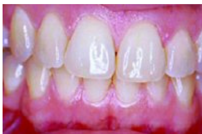
Slika 1. Klinička situacija prije izbjeljivanja

Rezultat reakcije je hidroksilni radikal. Reakcija se sporo odvija u uvjetima fiziološkog pH. Vodikov peroksid može penetrirati kroz caklinu i dentin, a također i difundirati kroz meko tkivo. U prisutnosti željeza i željeznih iona dekompozicija vodikova peroksida proizvodi vrlo reaktivne međuprodukte i kisik što doprinosi postupku izbjeljivanja.