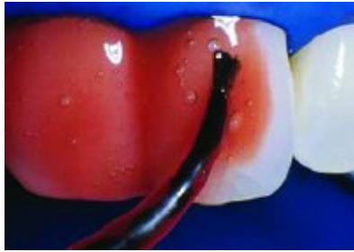
Slika 4. Nanošenje sredstva za izbjeljivanje na površinu zuba