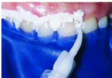
Slika 2. Nanošenje zaštitne paste na gingivu prije postavljanja koferdama