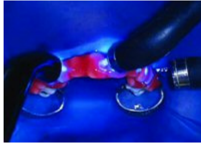
Slika 5. Grijanje i osvjetljavanje sredstva za izbjeljivanje