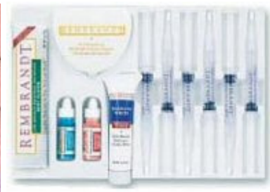
Slika 9. Rembrandt sustav za izbjeljivanje zubi

II. Izbjeljivanje matricom (nightgard vital bleaching) provodi se izradom matrice (individualne žlice) u koji se nanosi materijal za izbjeljivanje i aplicira na cijeli zubni luk. Obično se izbjeljuje čeljust po čeljust, a ona koja se ne izbjeljuje služi za kontrolu nijanse promijenjene boje zuba. Matrica se nosi uglavnom 1-4 sata dnevno, ali i duže, što ovisi o sustavu za izbjeljivanje koji se koristi. Terapija traje 2-6 tjedana tijekom kojih se stanje redovito kontrolira u ordinaciji. Moguće je kombinirati obje tehnike, koristiti jače sredstvo u ordinaciji uz aplikaciju topline uz blaže sredstvo za izbjeljivanje kod kuće što dovodi do najbržih i najpredvidljivijih rezultata. Indikacije za upotrebu matrice su blaža žuta ili žuto-smeđa obojenja, blaži oblici tetraciklinske diskoloracije, pacijenti s preosjetljivim zubima. Glavnu kontraindikaciju predstavljaju ekstremno preosjetljivi zubi, nemogućnost uspostave suradnje s pacijentom, teži stupnjevi diskoloracije, zubi s velikim ispunima.