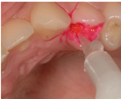
Slika 4a,b. Aplikacija karijes detektora i izgled kaviteta nakon aplikacije