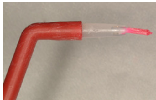
Slika 2a,b. Karijes detektor nanesen na vaticu i kistić