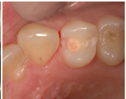
Slika 7. Izgled kaviteta na kraju preparacije