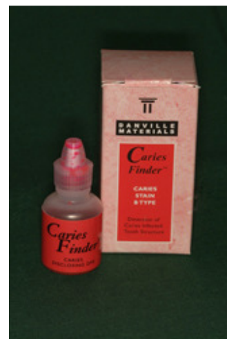
Slika 1. Caries finder®

Prema Fusayami, karijesni se dentin može podijeliti u dva sloja- vanjski i unutrašnji. Vanjski sloj (središte lezije) je inficiran, nekrotičan, demineraliziran sa ireverzibilno promijenjenim kolagenom i avitalan. Unutrašnji je sklerotični sloj bez bakterija, djelomično remineraliziran sa reverzibilno promijenjenim kolagenom te vitalan. Navedena je podjela vrlo važna za terapiju jer je prilikom preparacije potrebno u potpunosti ukloniti vanjski sloj uz maksimalno očuvanje unutrašnjeg. Granica između ova dva sloja je mekana kod akutnog i prilično tvrda kod kroničnog karijesa. Možemo zaključiti da nam u ovom slučaju samo boja i omekšanje ne mogu biti vodilje prilikom ukljanjanja karijesa ne poslužimo li se drugim navedenim metodama (vidi uvod).