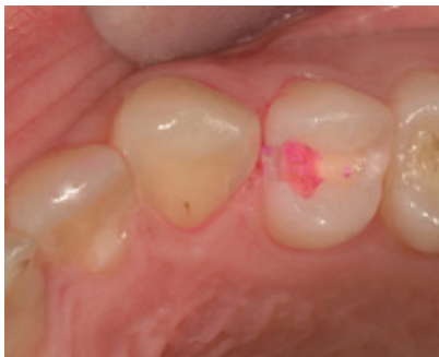
Slika 5. Izgled kaviteta nakon ispiranja boje