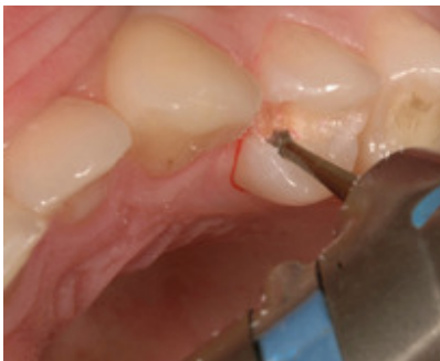
Slika 6. Uklanjanje obojenog dentina čeličnim svrdlom i izgled kaviteta na kraju preparacije