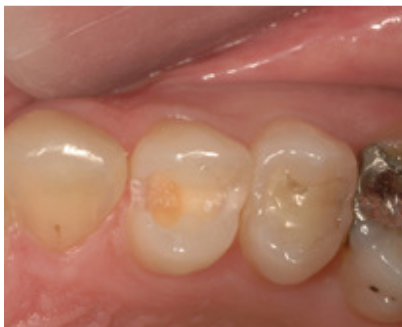
Slika 3. Zub 24 sa uklonjenim caklinskim pokrovom

Na susretljivosti i pomoći prilikom izradbe ovog rada zahvaljujem se Doc. dr. sc. Hrvoju Juriću. Na izradi fotografija zahvaljujem gđi Mirjani Krajačić.