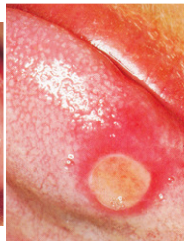
Slika 1. Afta maior (velika afta)