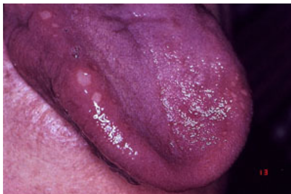
Slika 5. Aphthae herpetiformes