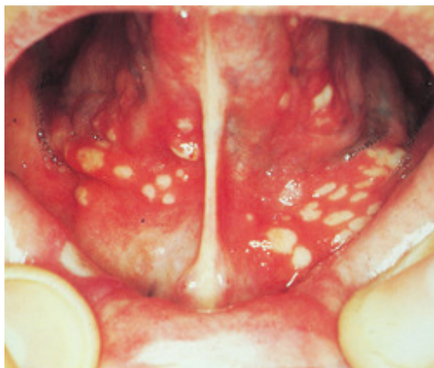
Slika 4. Aphthae herpetiformes