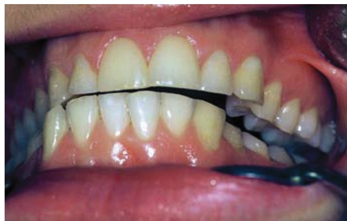
Slika 2. Brusne fasete govore o dominantno ekscentričnom tipu bruksizma (škripanje zubima)