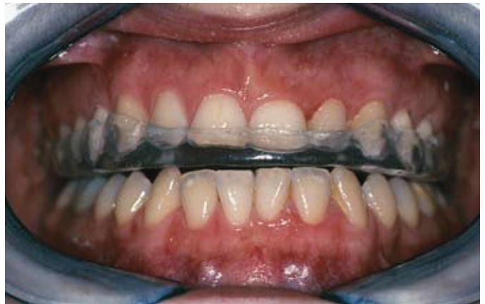
Slika 3b. Nova okluzijska udlaga u ustima pacijentice

buđenja bruksist imao stisnute zube, ili je njima škripao, može biti primjećen i noću tijekom buđenja, ali te su faze u spavanju teže zamjetljive, jer se odmah nastavlja slijedeći ciklus spavanja. U takvim trenucima netko u blizini može uočiti i potvrditi bruksističku aktivnosti noću. Tu se nezaobilazno u dobivanju potrebnih anamnestičkih podataka treba ući u sferu intimnog – partner pri spavanju dobar je svjedok da se poveže kauzalno noćni bruksizam i istošenost tvrdih zubnih tkiva. Naravno, osobna je stvar tko i kakvog partnera ili partericu ima pri sebi noć, ili uopće nema. Ako ništa drugo postoje susjedi – ostalom i hrkanje smeta uvijek nekome drugome samo je glasnije. U noćnom bruksizmu može se ogledati i psihičko raspoloženje osobe, a još više u pojavi dnevnog bruksizma. Naime, dnevni bruksizam, i to uglavnom stiskanje zubima, je gori oblik jer ne postoji za njega fiziološki razlog. U tom slučaju već i informiranost će doprinjeti da dnevni bruksist bude svjestan navika svojeg oralnog ponašanja. Aktivno sudjeluje u mjenjanju aktivnosti u trenutaku dnevnog bruksizma, ako nesvjesno parafunkcioniranje uzrokovano psihičkom nape-tošću, pomoći će u, naročito kad takva parafunkcija stvara štetne posljedice na zdravlje zubni. Uvijek je pitanje kad će se utvrditi da li postoje posljedice bruksizma, a time i sama bruksistička aktivnost.