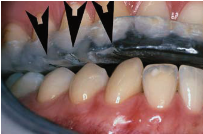
Slika 3a. Stara udlaga ima vidljive uzure kao posljedice istrošenosti zbog bruksizma