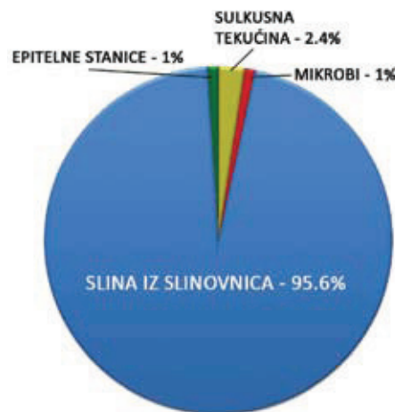
Slika 2. Sastav ukupne sline

Detekcija tumorskih markera u slini može doprinijeti ranoj dijagnostici različitih zloćudnih tumora. Primjerice, p53 je važan tumor-supresorski gen, čiji pro-