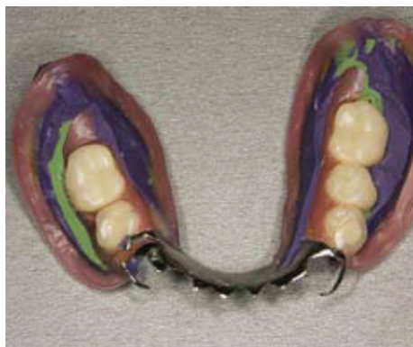
Slika 7. Otisak za indirektno podlaganje djelomične proteze.