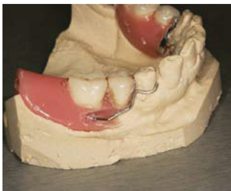
Slika 1. Modeliranje žičane kvačice

loma baze gornje proteze. U suprotnom potrebno je preko proteze u ustima uzeti otisak u alginatu. Ako prijelom baze ide čitavom dužinom proteze, onda je moguće da se pri uzimanju otiska dio pomakne. Zato se preporučuje da se prije uzimanja otiska u ustima učvrste dijelovi proteze autopolimerizirajućim