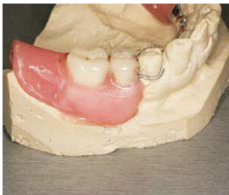
Slika 2. Prekrivanje akrilatom