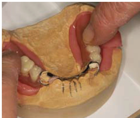
Slika 13. Postavljanje proteze na model i istiskivanje viška akrilata