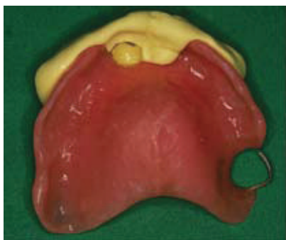
Slika 6. Otisak nakon vađenja

Kod reparature kvačice važno je utvrditi i otkloniti razlog oštećenja kvačice. Uzima se otisak preko proteze u ustima (2). Prilikom vađenja otiska potreban je povećani oprez kako ne bi došlo do pomaka proteze u otisku. Prije izlivanja modela potkopane površine proteze potrebno je prekriti voskom, kako bi nakon stvrdnjavanja sadre mogli izvaditi protezu bez straha da dio sadre pukne ili se odlomi. Sljedeći korak je analiza modela. Model je potrebno staviti u paralelometar kako bi utvrdili najpovoljniji smjer uvođenja proteze, ekvator zuba na kojem smiještamo kvačicu i potkopane predjele. Na zubu se ucrtta smještaj buduće kvačice, a potom se oblikuje kvačica od žice. (Slika 1.) Nakon oblikovanja kvačica se postavlja na zub na radnom modelu u željeni položaj, a kako bi ostala u točnom položaju za vrijeme dodavanja akrilata, zalijepi se ljepljivim voskom. Zatim se dodaje akrilat, koji se polimerizira, obrađuje i polira (4). (Slika 2. i 3.)