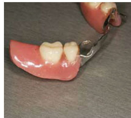
Slika 3. Nakon polimerizacije i poliranja