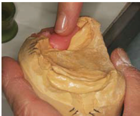
Slika 12. Nanošenje akrilata na model