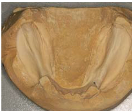
Slika 9. Radni model