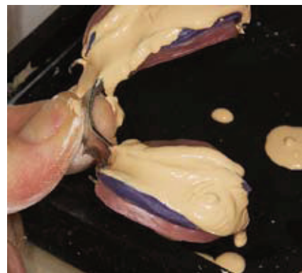
Slika 8. Lijevanje otiska u sadri