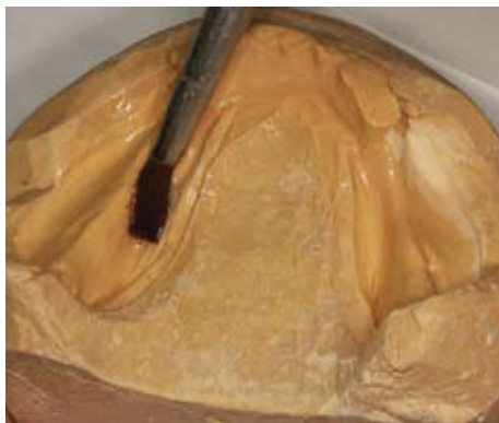
Slika 10. Premazivanje izolacijskim sredstvom