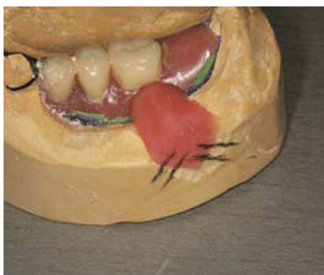
Slika 11a i b. Oblikovanje ključa od akrilata za provjeru točnosti prilijeganja proteze na model.