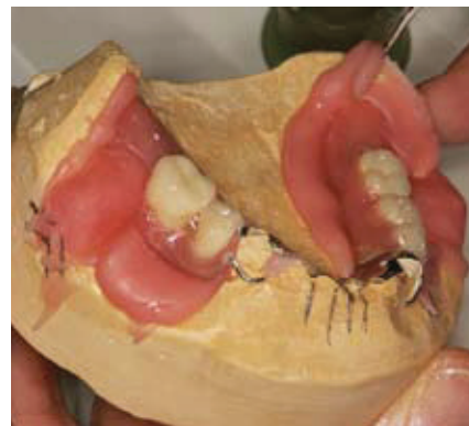
Slika 14. Uklanjanje viška akrilata

zubi najprije se uklanja puknuti zub. Pristup uklanjanju zuba mora uvijek biti napravljen s oralne strane, kako bi se zaštitile vestibularne strane proteze (ako je zub ispao navedeni postupak nije potreban). Važan korak je odabir novog zuba pri čemu treba paziti na oblik i nijanse boje, a potom se zub smješta na postojeće slobodno mjesto. Jako je važno smjestiti zub u pravilan položaj u odnosu na susjedne zube. Kada je zub pravilno postavljen učvrsti se za protezu s lingvalne strane ljepljivim voskom. Nakno toga provjerava se odnos s protezom u suprotnoj čeljusti. Vestibularni defekti također se popunjavaju voskom. Zamijeva se sadra i njome se prekriju sve vestibularne i okluzalne plohe zamjenskog i njemu susjednih zuba. Vosak se uklanja vrućom vodom, a na njegovo mjesto se stavlja autopolimerizirajući akrilat. U ovoj je fazi važna količina akrilata, jer premalo akrilata ostavlja praznine, a previše akrilata može smetati mekim tkivima ili poremetiti položaj zuba. Na-