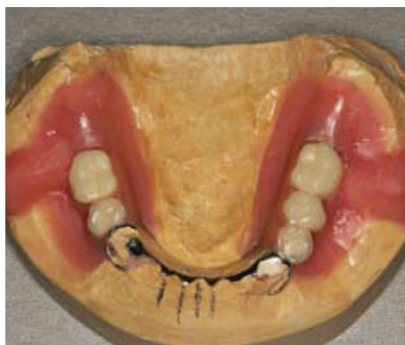
Slika 15. Nakon završnog oblikovanja

zubi najprije se uklanja puknuti zub. Pristup uklanjanju zuba mora uvijek biti napravljen s oralne strane, kako bi se zaštitile vestibularne strane proteze (ako je zub ispao navedeni postupak nije potreban). Važan korak je odabir novog zuba pri čemu treba paziti na oblik i nijanse boje, a potom se zub smješta na postojeće slobodno mjesto. Jako je važno smjestiti zub u pravilan položaj u odnosu na susjedne zube. Kada je zub pravilno postavljen učvrsti se za protezu s lingvalne strane ljepljivim voskom. Nakno toga provjerava se odnos s protezom u suprotnoj čeljusti. Vestibularni defekti također se popunjavaju voskom. Zamijeva se sadra i njome se prekriju sve vestibularne i okluzalne plohe zamjenskog i njemu susjednih zuba. Vosak se uklanja vrućom vodom, a na njegovo mjesto se stavlja autopolimerizirajući akrilat. U ovoj je fazi važna količina akrilata, jer premalo akrilata ostavlja praznine, a previše akrilata može smetati mekim tkivima ili poremetiti položaj zuba. Na-