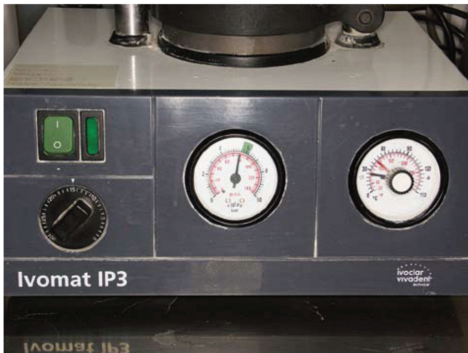
Slika 16. Aparat za polimerizaciju akrilata

Nakon provedenih priprema unosi se akrilatno tijesto za podlaganje, u ovom slučaju akrilat za toplu polimerizaciju. (Slika 12,13,14.) Kiveta se ponovno zatvara i mehanički preša te zatim kuha