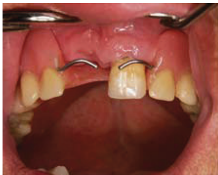
Slika 4. Zub je izvađen i potrebno ga je nadomjestiti proteznim zubom

akrilatom druge boje. Dijelovi slomljene proteze učvrste se u ustima pacijenta u točnom položaju. Otisak je dobar ako se dijelovi ne pomaknu i ako su međusobno spojeni bez međuprostora. U laboratoriju se izlije radni model i nakon vezanja gipsa, vadi se žlica s otisnim materijalom(2). Bilo je pokušaja reparature uz upotrebu metalnog «pojačivača» u obliku žice ili metalne mrežice sa ciljem jačanja čvrstoće proteze i samim tim produljenja trajnosti proteze. No, istraživanja su pokazala da upotreba takvih metalnih pojačivača zapravo više oslabljuje nego ojačava repariranu protezu. Različiti moduli elastičnosti metala i akrilata dovode do stvaranja mikropukotina te širenja i rasta takvih pukotina pri uporabi proteze (3). Kao nova metoda izbora nameće se uporaba impregniраних staklenih vlakana u matriksu od hladno polimerizirajućeg akrilata, koja su pokazala veću čvrstoću reparirane proteze u odnosu na istovjetnu nerepariranu.