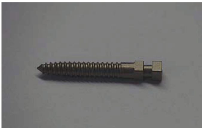
Slika 3. Konfekcijska nadogradnja, intraradikularni dio