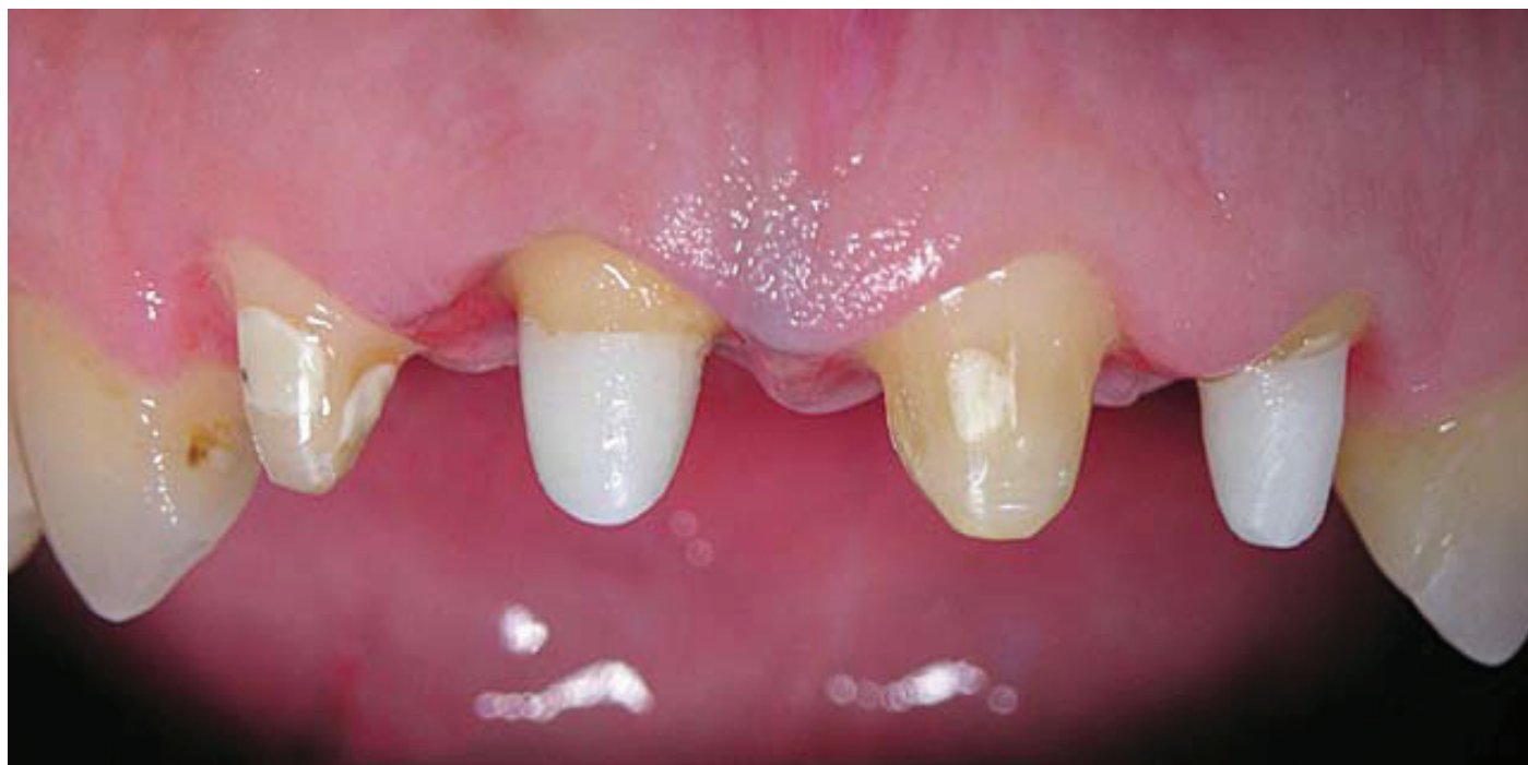
Slika 5. Cementirane cirkonijeve nadogradnje 11 i 22

lagodne obliku i duljini korijenskog kanala svakog pojedinog zuba za koji se izrađuju. Takve nadogradnje cementiraju se u korijenski kanal i ako su pravilno izrađene gotovo je nemoguće njihovo kasnije uklanjanje i revizija punjenja korijenskog kanala. Uglavnom su vrlo rigidne (neelastične) te tvore monoblok sa zubom s vrlo malom količinom spojnog međumaterijala (cementa). Vertikalne sile uglavnom su dobro distribuirane i najjače se oko vrha individualne nadogradnje. Ekscentrične lateralne sile prenose uglavnom preko vrha nadogradnje (princip poluge) no ukoliko je nadogradnja dovoljne duljine te sile su uglavnom malene [1].