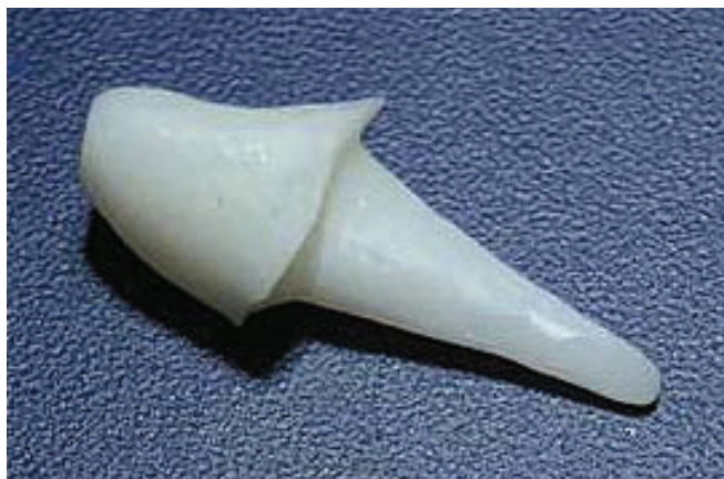
Slika 2. Cirkonska nadogradnja