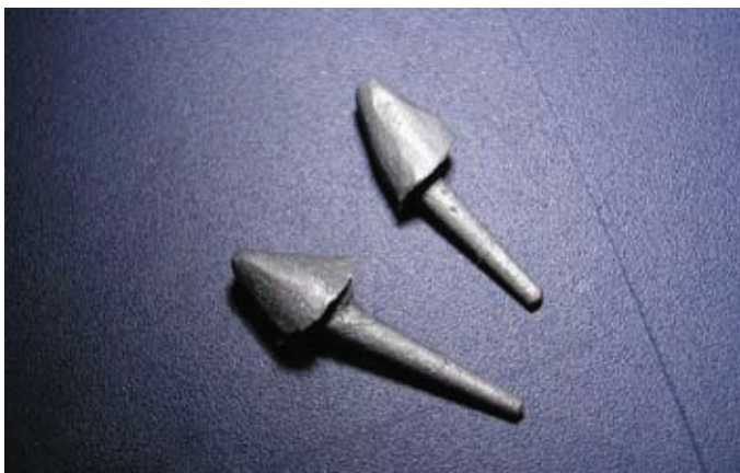
Slika 1. Lijevane individualne nadogradnje

Najčešće se sastoje od kolčića koji je korijenski dio i jezgre koja je koronarni dio. Jezgra se izrađuje direktno u ustima, a može biti kompozitna, stakleno iono-