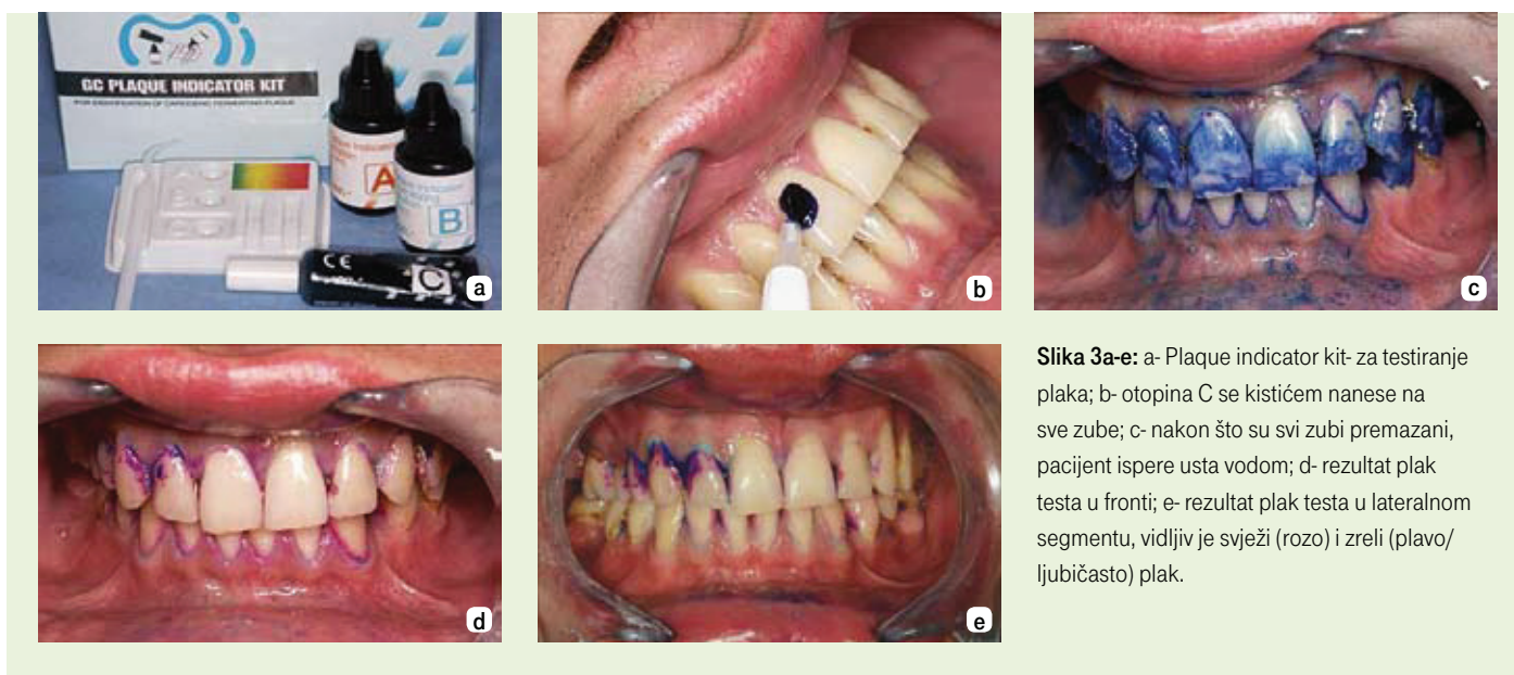
Slika 3a-e: a- Plaque indicator kit- za testiranje plaka; b- otopina C se kistićem nanese na sve zube; c- nakon što su svi zubi premazani, pacijent ispere usta vodom; d- rezultat plak testa u frontu; e- rezultat plak testa u lateralnom segmentu, vidljiv je svježi (rozo) i zreli (plavo/ ljubičasto) plak.