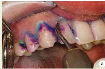
Slika 5a-b: a- PMTC- uklanjanje zubnog plaka ultrazvučnim instrumentima; b- poliranje zuba pastom nakon uklanjanja plaka.

U prevenciji nastanka karijesa dokazana je učinkovitost primjene topikalnih fluorida u zubnim pastama, gelovima i lakovima te otopinama za ispiranje. Međutim, za remineralizaciju na dva iona flora potrebno je deset kalcijevih i šest fosfatnih iona \text{Ca}_{10}(\text{PO}_4)_6\text{F}_2 . U nedostatku kalcijevih i fosfatnih iona, što je posebno očito kod stanja koja uzrokuju suhoću usta, izostaje i remineralizacija.