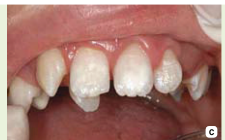
Slika 6a-c: a- bijele mrlje na gornjim središnjim sjekutićima; b- primjena MI Plus paste za remineralizaciju; c- izgled bijele mrlje nakon 3 mjeseca.