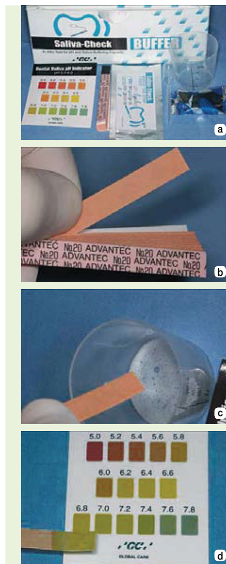
Slika 1a-d: a- Saliva-Check- za testiranje sline; b- papirići za određivanje pH vrijednosti sline; c- papirić se kratko uroni u posudicu sa sakupljenom stimuliranom ili nestimuliranom slinom; d- nakon 5 minuta se očita pH vrijednost sline.

Plak test je korisno pomoćno sredstvo koje omogućuje stomatologu i pacijentu uvid u održavanje oralne higijene. Prije su se za bojenje zuba koristili tzv. revelatori kao što su otopina eozina i gencijanaviolet. Danas postoje tvornički testovi koji su jednostavniji za primjenu i osim dentobakterijskog plaka ne boje okolne strukture. Noviji testovi osim što pokazuju ima li plaka na promatranim plohama zuba, daju nam i uvid u zrelost plaka i njegovu metaboličku aktivnost (slika 3a-e). Tako