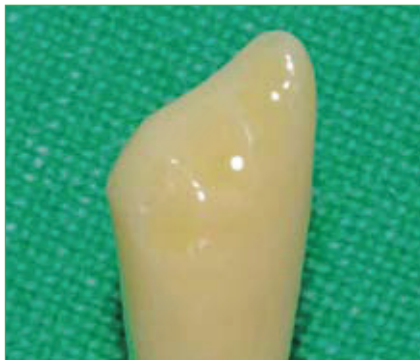
Slika 8. Vestibularni pogled na valovito zakošenu vestibularnu caklinu.