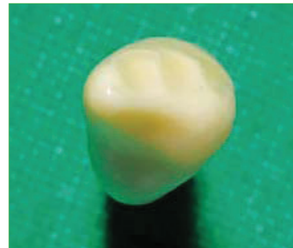
Slika 9. Okluzalni pogled na preparaciju s valovito zakošenom vestibularnom caklinom.

Ijanja adhezijskog sustava susjedni zub se izolira glicerinom pomoću nenavoštene zubne svile. Kod postavljanja kompozitnog materijala prvo se izrađuje dentinska jezgra koristeći opakniji materijal. Slojevi koje postavljamo trebaju biti što manji. Svaki sloj polimeriziramo 10 sekundi tako da svaki slijedeći ima čvrstu podlogu, a i time olakšavamo izradu ispuna. U ovoj fazi možemo pogriješiti na način da napravimo preveliku dentinsku jezgru, te je potrebno obratiti pažnju na dimenzije. Nakon pravilno oblikovane dentinske jezgre postavlja se caklinski sloj koji se oblikuje, a prije završne polimerizacije se kistom aplicira tanak sloj inhibitora kisika (premaz koji će spriječiti inhibiciju polimerizacije kisikom) te se polimerizira 60 sekundi. Tada slijedi završna obrada i poliranje. Lingvalna stjenka se oblikuje koristeći plamičasto svrdlo bez vode s laganim dodirima strogo pazeći na zagrijavanje zuba. Obrada bez vode nam omogućuje bolju vizualnu kontrolu što pridonosi boljoj estetici (11).