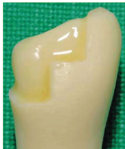
Slika 2. Vestibularni pogled na stepeničastu preparaciju sa žlijebom. Okomiti dijelovi preparacije nalaze se u području prirodnih vestibularnih brazda.