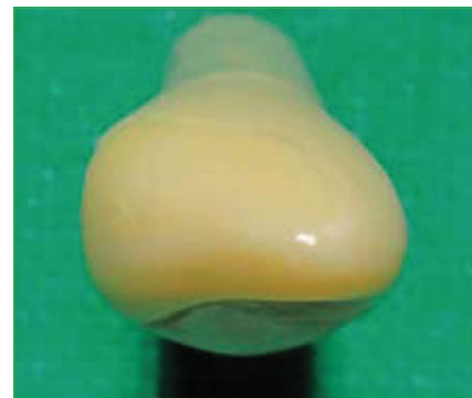
Slika 5. Okluzalni pogled na preparaciju zakošavanja ruba. Uočljiv zaobljen dentinski dio preparacije i izostanak oštih rubova.

Preparacija zakošavanja ruba je nešto jednostavnija (slike 4. i 5.). Prednosti su joj reducirano brušenje zdravog tkiva