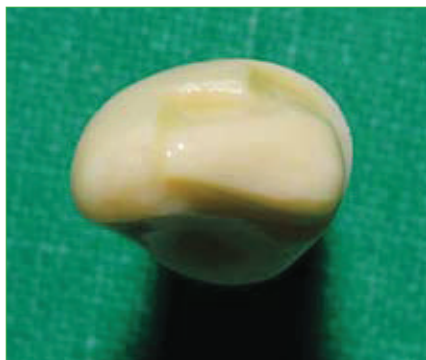
Slika 3. Okluzalni pogled na stepeničastu preparaciju sa žljebom. Stepičasta forma izvedena je samo na vestibularnom dijelu preparacije. Dubina preparacije seže do polovice debljine cakline.