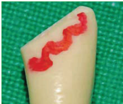
Slika 7. Vestibularni pogled na vodootporni markerom obilježeni valoviti rub preparacije.