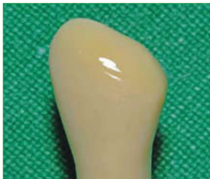
Slika 4. Vestibularni pogled na preparaciju zakošavanja ruba. Uočljivo je zakošenje cakline sa zaobljenim dentinskim dijelom.

U najvećem broju slučajeva obradom caklinskih rubova povećavamo površinu za koju će se restaurativni materijal vezati i time osiguravamo bolju retenciju, ali i osiguravamo da prijelaz između kompozitnog materijala i zubnog tkiva bude stupnjevit, tj. da rub preparacije ne bude izrazito vidljiv nego da se postupno stapa